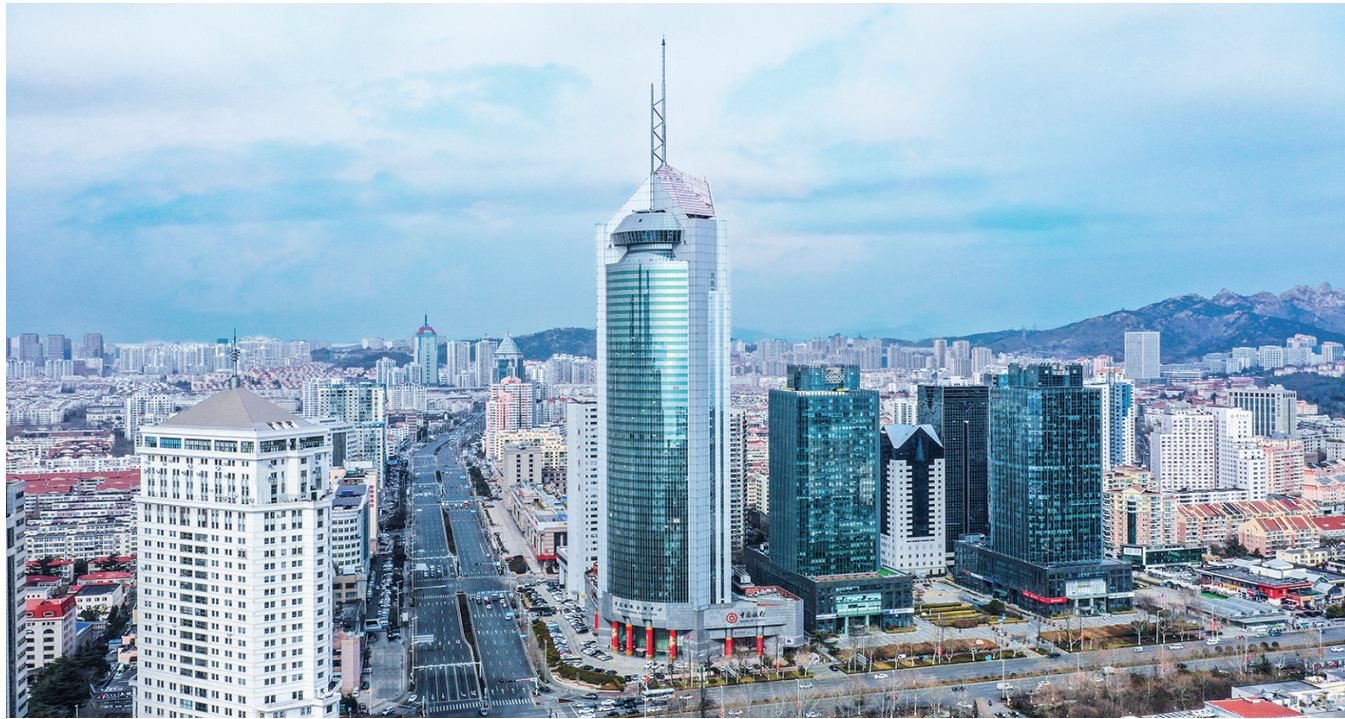
■中国银行青岛市分行。

引金融活水，助产业乘风。在青岛创新之城建设的壮阔征程中，青岛中行将坚定不移走好中国特色金融发展之路，在支持实体经济发展中勇立潮头、深度融入城市创新发展脉络，当好地方经济发展的提速引擎、服务先锋，不断优化服务模式与产品体系，支持各项创新成果竞相涌现，实现城市能级与核心竞争力提升的新跨越，绘就支持产业与城市协同共进的绚丽画卷。