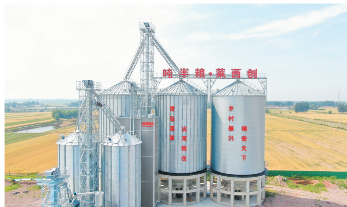
沽河街道万亩藤稔葡萄鲜食基地。