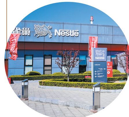
位于沽河街道的雀巢青岛公司。

近年来，莱西市沽河街道立足农业资源禀赋和高端食品饮料产业优势，在推进项目建设、深化农村改革、抓实惠民工程上狠下功夫，不断开创精彩沽河高质量发展新局面