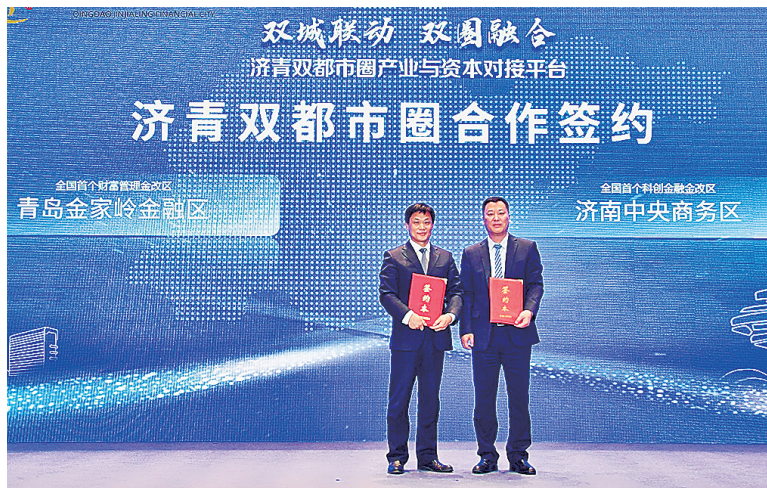
■济青双都市圈合作签约。

“统筹推进财税、金融等重点领域改革”等要求，与金融监管部门密切协同，争创国家新一轮的金融改革创新试验区，为金融区下一个十年的发展赢得政策空间；纵深推进契约型基金、金融司法协作等不同方向的改革创新工作，努力形成实践经验和创新亮点，输出过硬改革案例，彰显金融区先行示范效应。