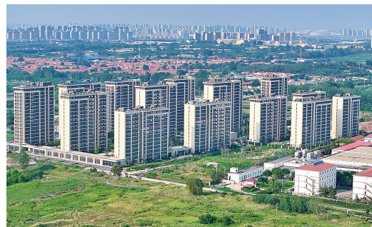
■红岛街道宿流回迁安置区。