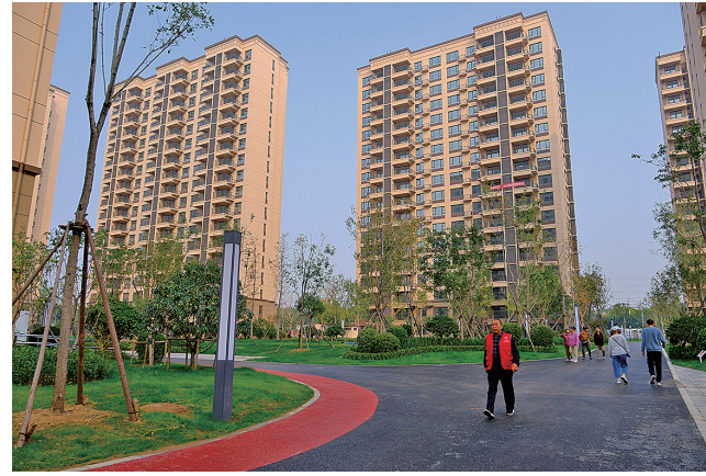
■东宅子头 回迁安置区崭新的 楼房和优美的 绿化环境。

经验。”据介绍，从试点到推广，城阳区计划在今年年底前再交付两到三个“数字家庭”安置社区，惠及约5000户居民，明年还将有更多的社区加入，“数字家庭”建设正在惠及更多旧改项目家庭。