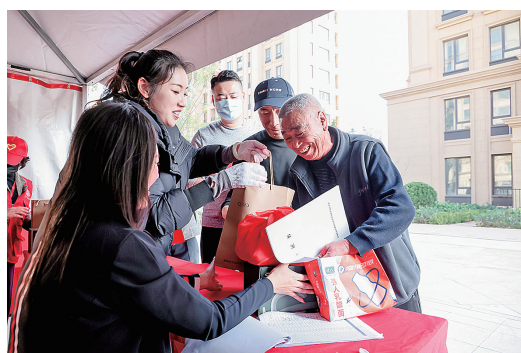
■河套街道罗家营社区居民正在领取新房大礼包。

民以居为安。旧改回迁事关百姓安居乐业，是重要的民生工程、民心工程。面对旧村改造这道民生“重点题”，城阳区何以给出“高分答卷”？把老房子改造成好房子，这里又创造了怎样“人无我有，人有我优”的成功范式？