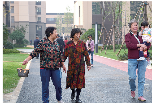
■夏庄街道 东宅子头社区居民参观回迁社区。

居民养老有保障。以改造社区为单位，按照相关标准给予社区一次性养老补助，形成居民养老基金，用于社区居民养老补贴，对符合领取条件的居民和经认定的特殊群体给予补助，确保了老年人生活质量，减轻家庭养老负担。