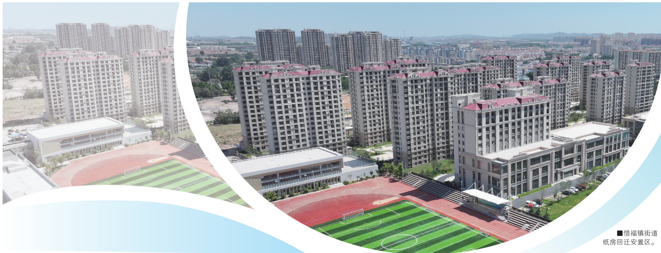
■惜福镇街道 纸房回迁安置区。

自2022年实施城市更新和城市建设以来，城阳区已回迁社区37个，建设安置房5万余套，涉及居民2.5万户；到2024年底，回迁社区预计达42个，平均每年回迁14个，共计10万名居民圆梦新居