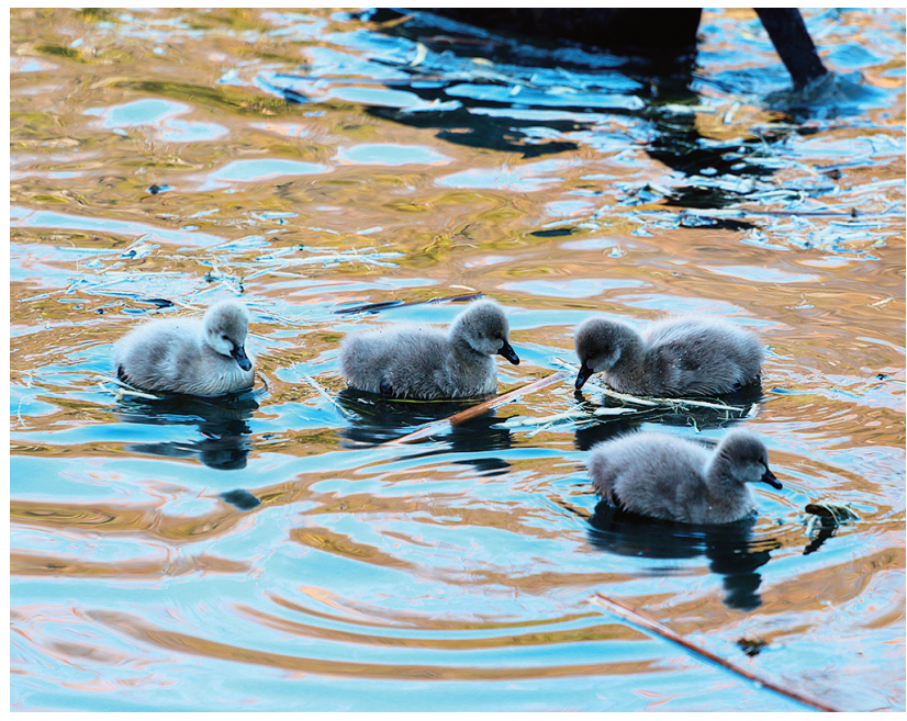
■黑天鹅“萌宝”如同灰色小绒球。