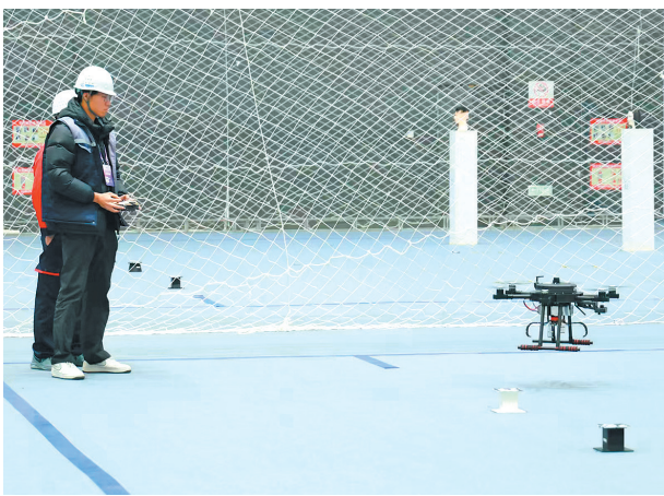
■两名选手在比赛中紧密配合。