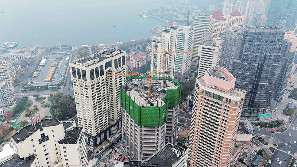
■ 航运贸易金融总部大厦项目正在加紧施工。

质量立得住，品牌才能叫得响。如何打造高品质、高认可度、高竞争力的“青岛优品”公共品牌，壮大“青岛优品”影响力？关键在于打牢品牌质量根基，厚植品牌优势，打造出经得起时