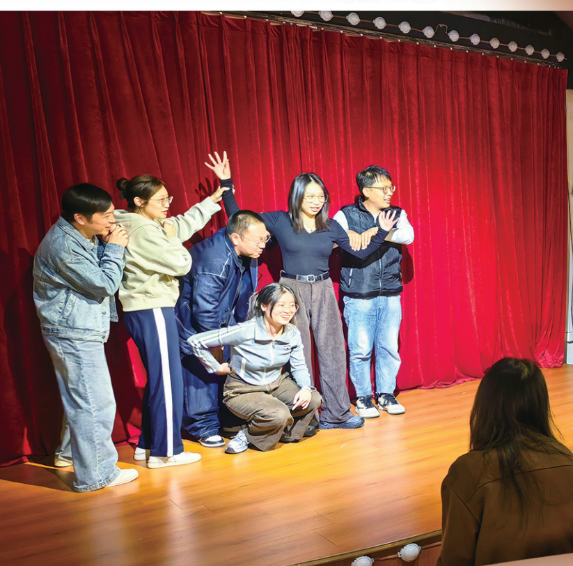
■年轻人在M23沙空间参加即兴喜剧体验。

熙熙攘攘的台东步行街，似乎永远不缺客流。但显然，坐拥“天然流量池”的台东并未止步于此。业态升级、品牌革新、活动焕新……伴随着城市更新和商业变革，新的街区模式和生态重塑，百年商街烟火气与潮流范儿流淌，