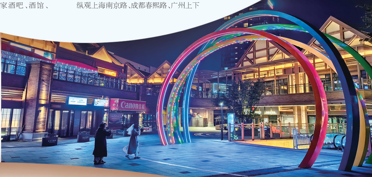
■夜晚的大悦城灯火璀璨。