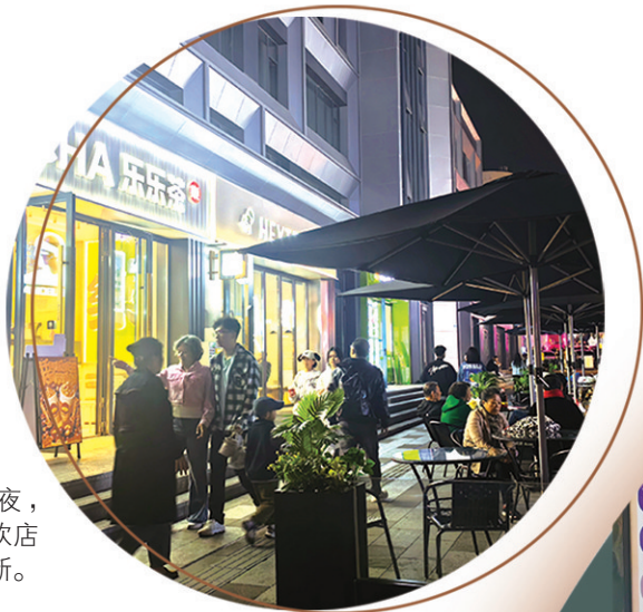
■入夜，台东的茶饮店铺客流不断。

百年前，青岛最早的商贸“活水”自台东镇涌流。彼时，台东镇商贸云集、商号林立、市埠繁荣，流传着“有钱不出东镇”的老话。百年后的今天，台东依旧是青岛热门商圈。在今年国庆假期期间，街区客流“破圈”，七天纳客达326.1万人次，日高峰近55万人次，营业额达2.9亿元，均创历史新高。