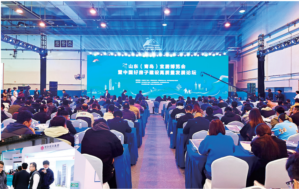
■11月1日至3日,2024山东(青岛)宜居博览会暨中国好房子建设高质量发展论坛在青岛国际会展中心举行。

作为全国首个绿色城市建设发展试点,近年来青岛城乡建设绿色低碳发展得到大幅提升,围绕绿色金融、绿色建造、绿色生活、绿色生态,形成8方面20条可复制可推广的经验。累计建成绿色建筑1.43亿平方米,推广星级标识绿色建筑2271万平方米,推广超低能耗建筑116万平方米。借助本届宜博会,不仅向外界展示了智能建造和绿色建筑成果,还传递着青岛这座宜居宜业宜游的品质之城迈向更高水平的信心。