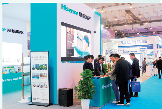
■海信、保利、华润等知名房企优质项目吸引购房者前来咨询。