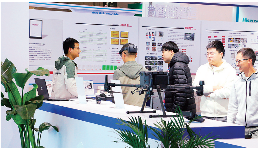
■观展市民体验智能设备。

从安家到安心,从安居到宜居,住上“好房子”日益成为市民的热切期盼和时代呼唤。在本届宜博会上,“好房子”成为展示和讨论的热点话题。从方案设计到建设施工,再到验收交付,房地产行业的新形势下,对“好房子”提出了更高标准。