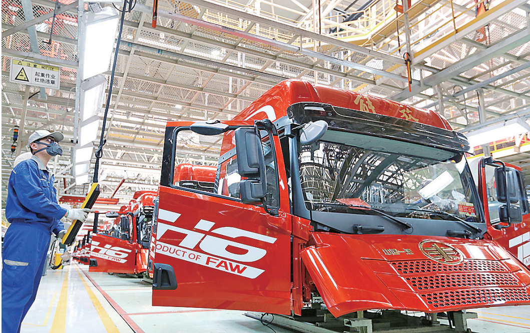
■一汽解放青岛汽车有限公司内,工人们在赶制订单,满足国内外市场需求。