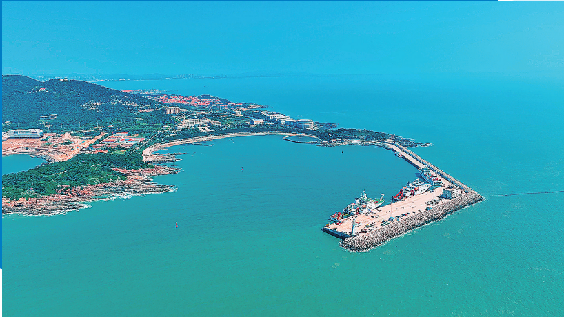
■“蛟龙号”母港国家深海基地。

围绕“突出科技创新引领,瞄准高端化、智能化、绿色化,加快推动主导产业做强做大,努力为全市高质量发展作出更大贡献”这一要求,即墨区立足资源禀赋,打出一系列改革“组合拳”,有序深化各领域改革,推动海洋产业全面起势、传统产业提质升级、营商环境持续改善、民生质量稳步提升,区域发展格局呈现新面貌。