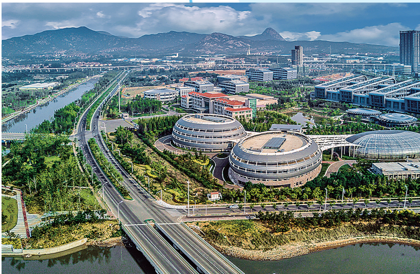
■即墨区持续推动重大涉海科研机构、高校科研院所集中布局,聚集崂山实验室等一批“国字号”科研机构,打造了全国领先的海洋高端要素集聚地。

海洋是即墨区最大的特色和资源禀赋。青岛市委提出建设引领型现代海洋城市,赋予即墨“当好海洋经济发展排头兵”的使命。即墨区坚持“陆海统筹、全域皆蓝”的发展理念,聚焦资源汇聚、技术攻关、成果转化、项目招引等方面持续攻坚,加速构建现代海洋产业体系。