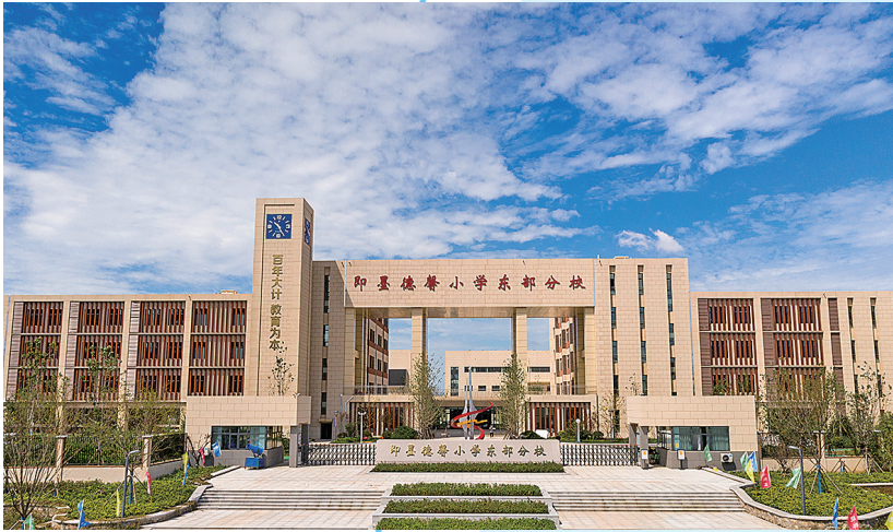
■即墨区深入实施“强校提质”“强镇筑基”教育改革试点,不断扩增基础教育优质资源,近三年共建成启用二十八中东部分校等中小学、幼儿园75处。