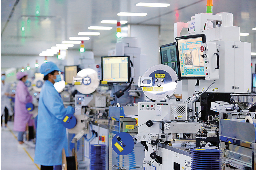
■青岛泰睿思微电子有限公司通过采用新技术、新工艺、新设备、新材料,增强企业拓展市场能力。图为公司工人在芯片测试生产线上检验产品质量。

以改革释放发展动能,以创新激活增长引擎。在高质量发展的赛道上,即墨这座千年商都已“提速竞跑”。