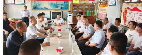
■“齐鲁富民贷”座谈会现场。