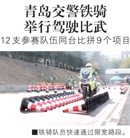
■铁骑队员快速通过限宽路段。

从产前的节肥、节药,到生产时的质量监管、产品检测,再到展销环节的动态管理、优胜劣汰……在做大“青岛农品”影响力的同时,青岛深化国家农产品质量安全市建设,突出产管结合,建立从田头到餐桌全过程质量监管体系,以一系列的强监管机制和行动确保“青岛农品”品质为先。据统计,青岛已制定173项农业地方标准,主要农作物生产实现全过程有“标”可循。