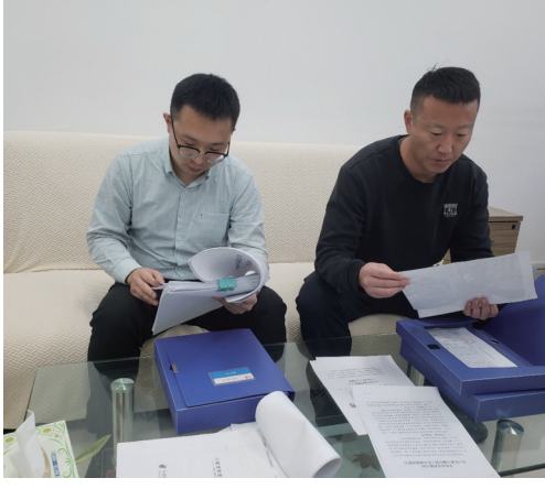
■平度市农业农村局工作人员查看档案资料。