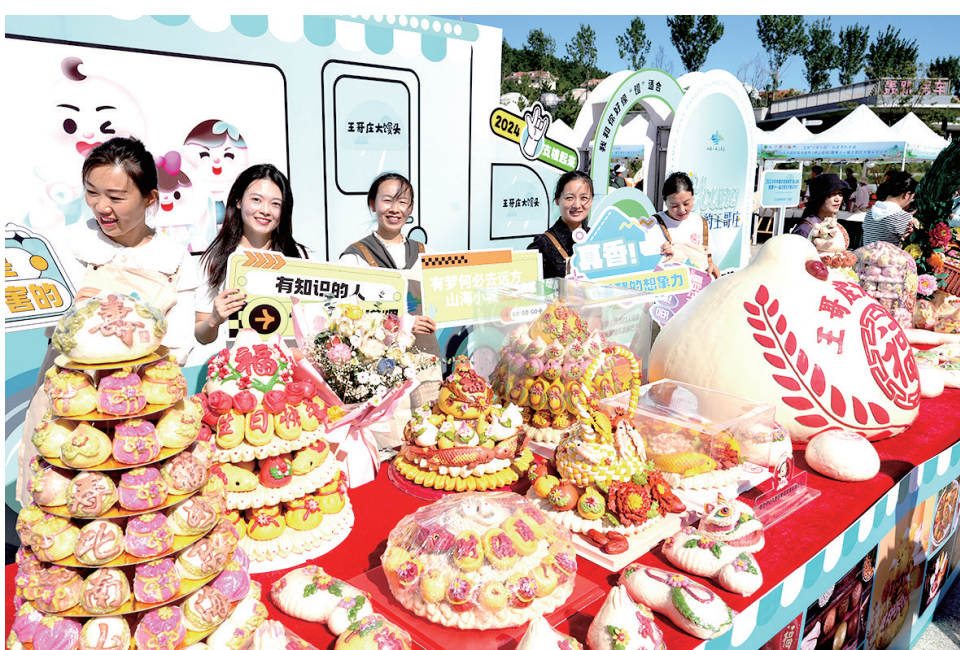
■王哥庄大馒头节已举办十一届,成为宣传推广品牌的重要平台。

品牌建设,是农产品“出圈”的关键一招。 截至目前,青岛培育农产品品牌2.2万余个,其中,国家地理标志农产品54个,位居全国副省级城市首位;全国名特优新农产品67个、特质农产品32个,入选数量均居全省首位。“青岛农品”区域公用品牌已完成商标注册和版权保护,连续5年入选全国区域农业品牌“十强”。青岛连续三轮获得全国“菜篮子”市长负责制考核优秀等次,农产品出口额稳居全国同类城市首位。 青岛市农业农村局局长袁瑞先介绍,青岛坚持把品牌作为现代农业高质量发展的重要标志,持续加大政策和财力支持,撬动社会投入,加快农业品牌培育推广,培育出王哥庄大馒头、胶州大白菜、崂山茶、黄岛蓝莓等一批在全国影响力大、市场占有率高的农产品品牌,带动农产品市场交易额突破千亿元大关。 没有质量就没有品牌,质量是品牌的生命。“青岛农品”区域品牌培育过程中,始终在“品”上下真功夫,深化国家农产品质量安全市建设,持续加强从田头到餐桌的全过程监管,并制定农业地方标准和技术规范270项,建设农业标准化生产基地1200余处,实现主要农作物生产有“标”可循。 以青岛当地的特色农产品胶州大白菜为例,为保持“胶白”长久以来的品质,2004年胶州