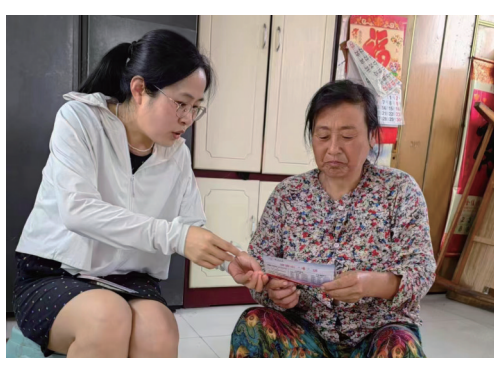
■李园街道办事处帮扶干部入户走访。