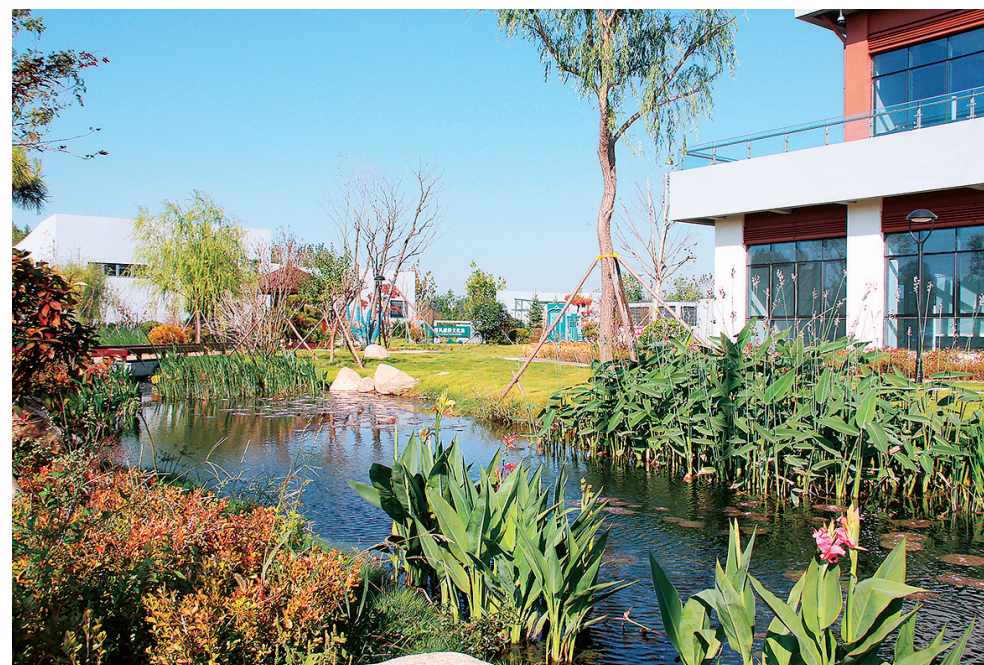
■即墨区北部污水处理厂“隐身”地下，地上为开放式公园。

污水处理厂兼具“颜值”与“智慧”，得益于全市“两个清零、一个提标”攻坚行动的推进。“两个清零、一个提标”，即“城市建成区雨污合流管网清零、城市建成区黑臭水体清零、城市污水处理厂出水水质提标”。