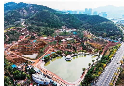
■双峰山项目雏形已现，计划年底对外开放。