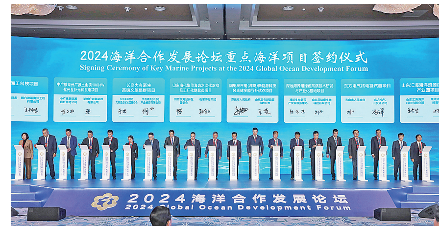
■2024海洋合作发展论坛重点海洋项目签约仪式现场。韩星摄