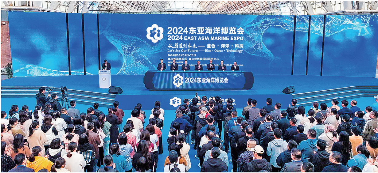
■10月24日，2024东亚海洋博览会启幕。

本次东亚海洋博览会专门设置山东海洋发展成果展区，集中展示山东省及青岛、烟台、威海、日照、东营、潍坊、滨州7个省内沿海城市在海洋经济、海洋生态、海洋港口、海洋科技、海洋对外合作等领域取得的显著成效。突出