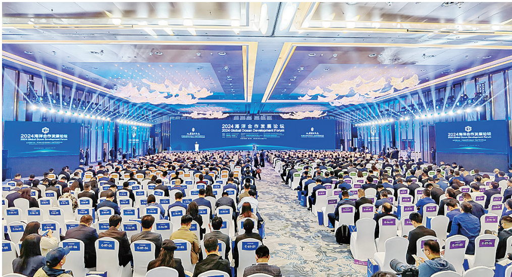
2024海洋合作发展论坛开幕式现场。

主席嘱托,聚焦海洋经济高质量发展,深入实施海洋强省建设“十大行动”,全力打造现代海洋经济发展高地。举办海洋合作发展论坛,是落实习近平主席重要指示要求、深入践行海洋命运共同体理念的具体行动。我们愿同各方一道,携手推动海洋经济合作,合力构建现代海洋产业体系,携手促进海洋科技创新,推动