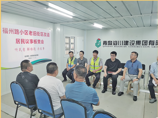
■福州路小区召开老旧小区改造居民议事板凳会。