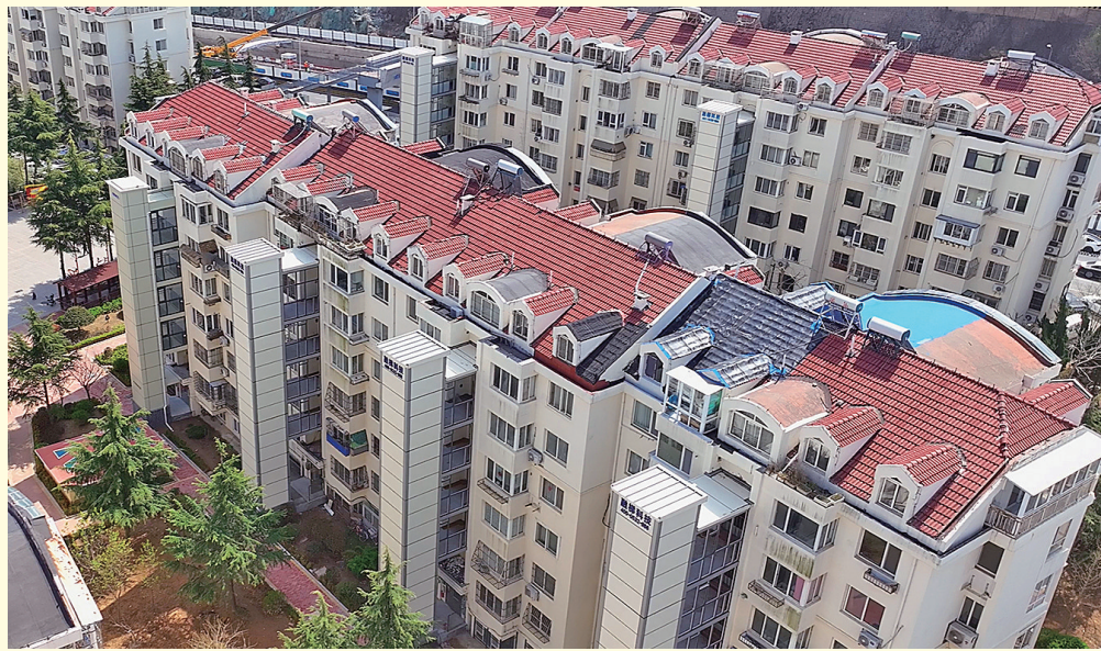
■目前，恒苑小区已实现39部电梯连片加装。