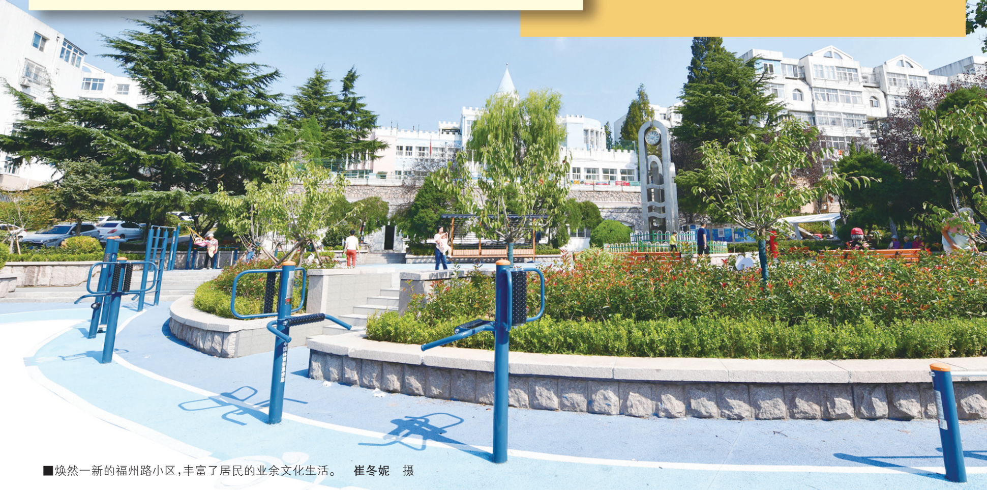
■焕然一新的福州路小区，丰富了居民的业余文化生活。