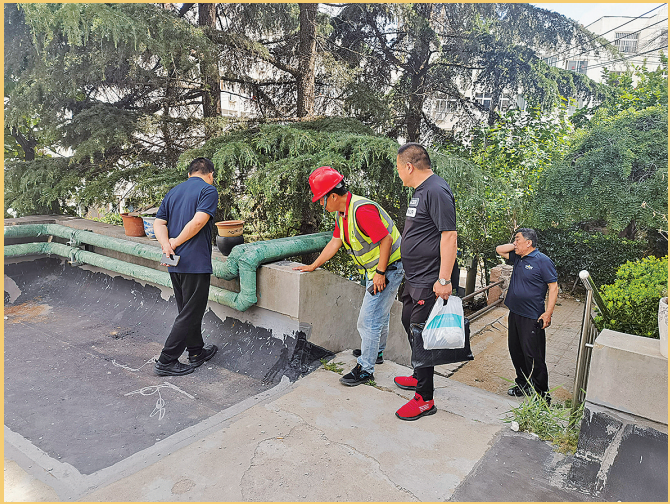
■“能人”监督员现场查看福州路小区改造情况。