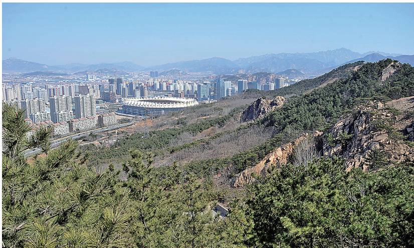
▲整治提升前的浮山森林公园(摄于2015年)。 ▶整治提升后的浮山森林公园绿道蜿蜒伸展。