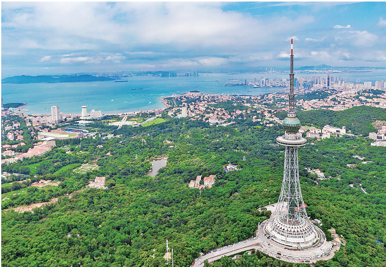
■整治提升后的太平山草木更葱茏。

良好的生态环境是最普惠的民生福祉。在青岛这座山海相依、城景交融的城市里，山体绿地无疑是其中宝贵的生态资源，而浮山、太平山犹如城市中的两大“绿心”，镶嵌在繁华都市之中。