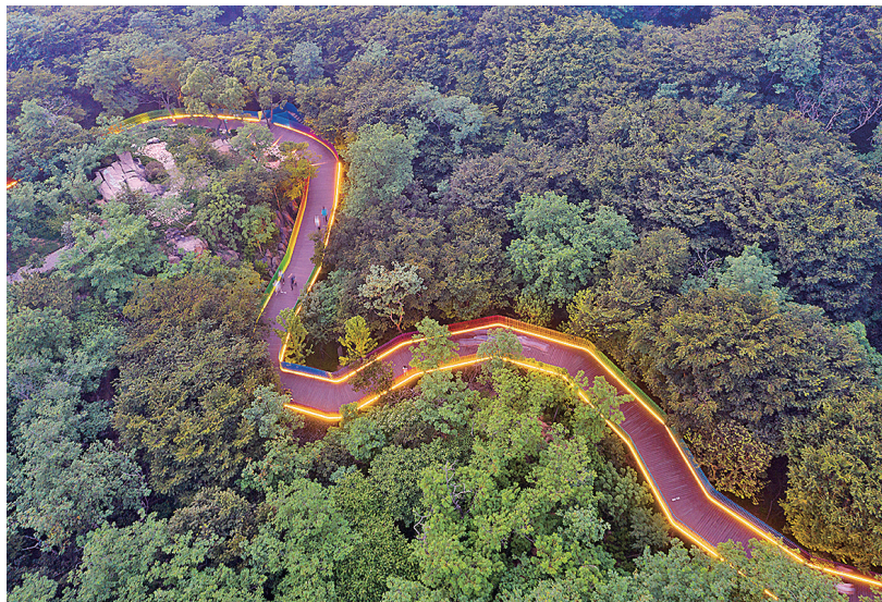
■彩虹栈道是太平山中央公园绿道的精彩“段落”。