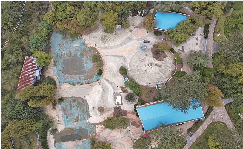
■建设中的太平山中央公园欢乐丛林游乐园(摄于2021年)。