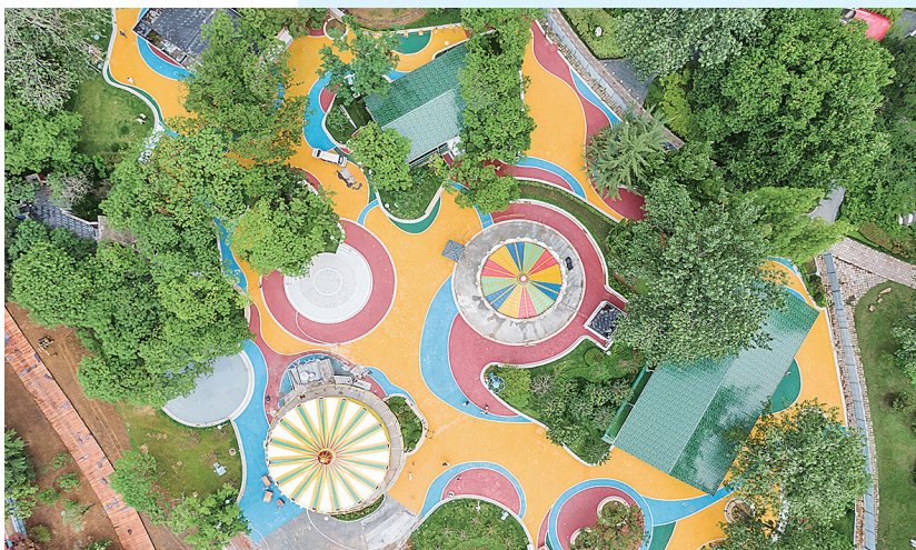
■太平山中央公园欢乐丛林游乐园。