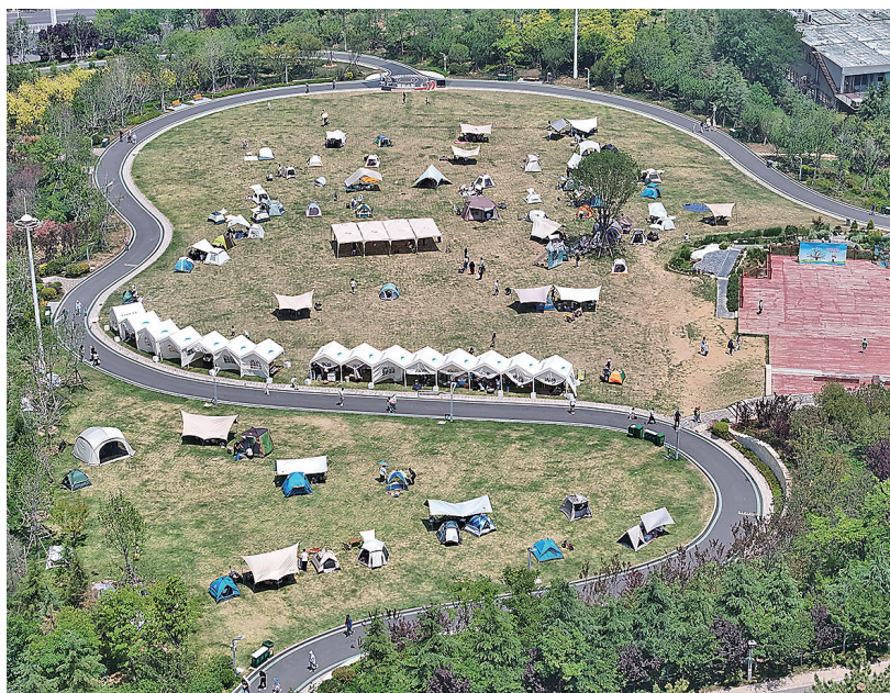
■迤逦而行的浮山绿道成为网红打卡地。