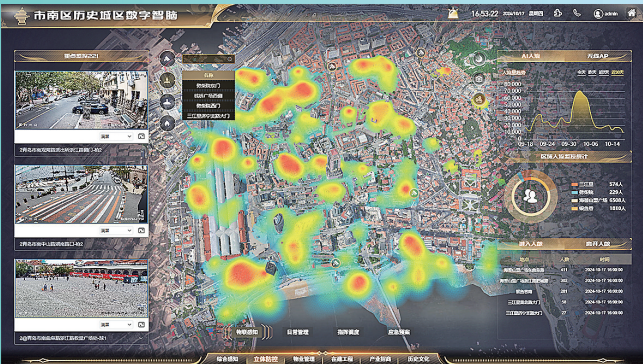
■市南区历史城区数字智脑平台。