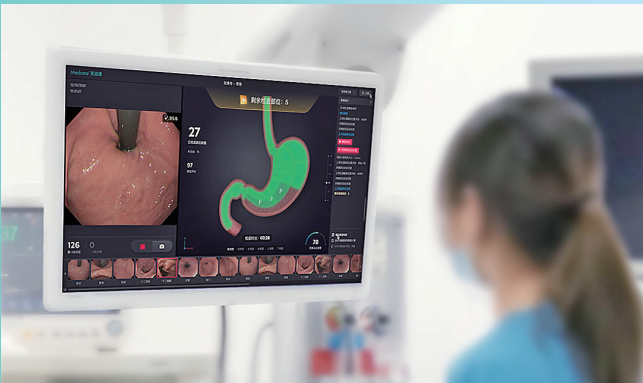
■医护人员正在使用青岛美迪康研发的AI辅助系统进行诊疗。