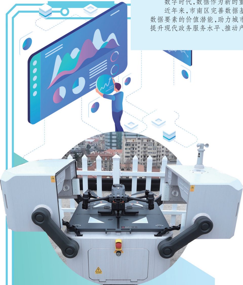
■用于智慧巡飞的无人机。

数字时代,数据作为新的重要战略资源和关键生产要素,正深刻改变着社会生活方式、生产方式和治理方式。近年来,市南区完善数据基础制度和基础设施建设,探索推进数据要素市场化配置工作,释放数据要素乘数效应,发挥数据要素的价值潜能,助力城市数字化、智慧化转型。以应用场景为牵引、市场主体需求为驱动,数据要素已经成为市南区提升现代政务服务水平、推动产业升级和实现区域经济高质量发展的新引擎。