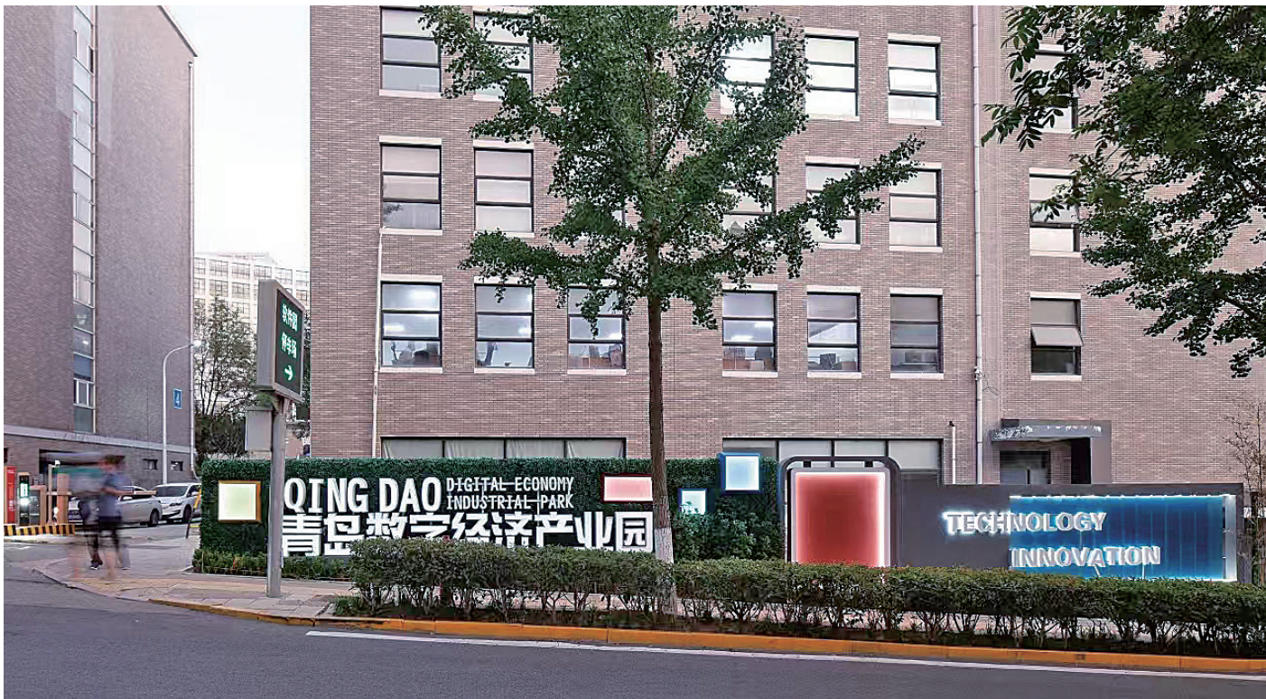
■青岛数字经济产业园外景。