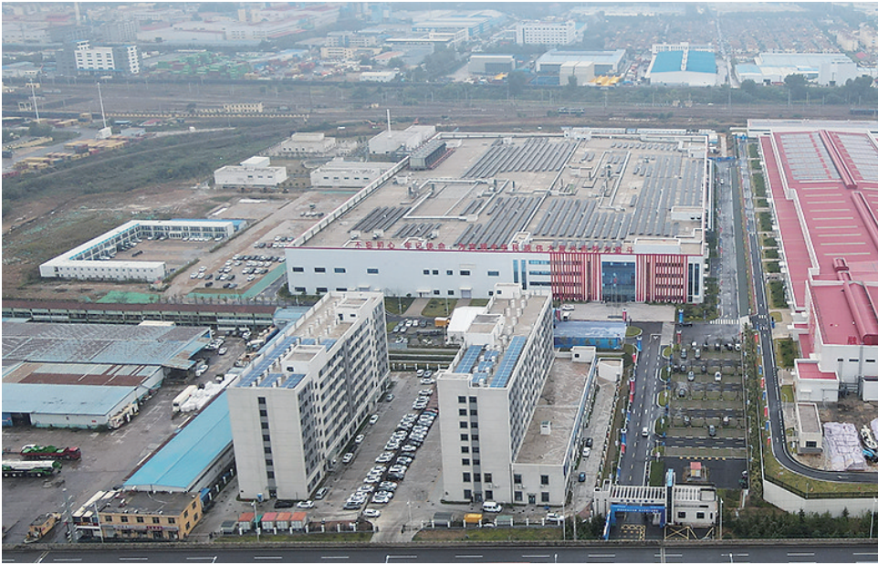
■俯瞰青岛光电产业园超薄电子玻璃项目。

□青岛日报/观海新闻记者 张晋 本报10月18日讯 18日上午,青岛光电产业园超薄电子玻璃项目产品下线 and 点火投产活动在西海岸新区举行。活动中,青岛融合智能科技有限公司实现第一块30英寸商显产品下线,青岛融合新材料科技有限公司Mini LED 背板生产线成功点火。 此次投产的超薄电子玻璃项目,主要规划建设Mini LED 背板玻璃生产线、3D车载盖板保护玻璃生产线,可年产Mini LED背板4000万平方米、3D车载盖板保护玻璃2400万片,属于新型显示产业链的上游关键材料环节。项目投产,标志着青岛市新型显示产业研发生产能力进一步提升,“芯屏”产业配套体系进一步完善,对于加快构建具有核心竞争力和上下游耦合协同的全产业链发展格局具有重要意义。 青岛光电产业园是青岛市新型显示产业园的重要组成部分,先后建成投产了高新标显显示用载板玻璃、高端装备及研究院等项目,形成涵盖光电子显示领域装备制造、核心原材料、零部件组装等完整的产业体系,助推青岛