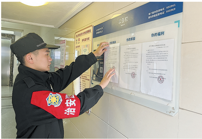
■“技防+人防”为小区加上了一道坚实的“安全防护锁”。