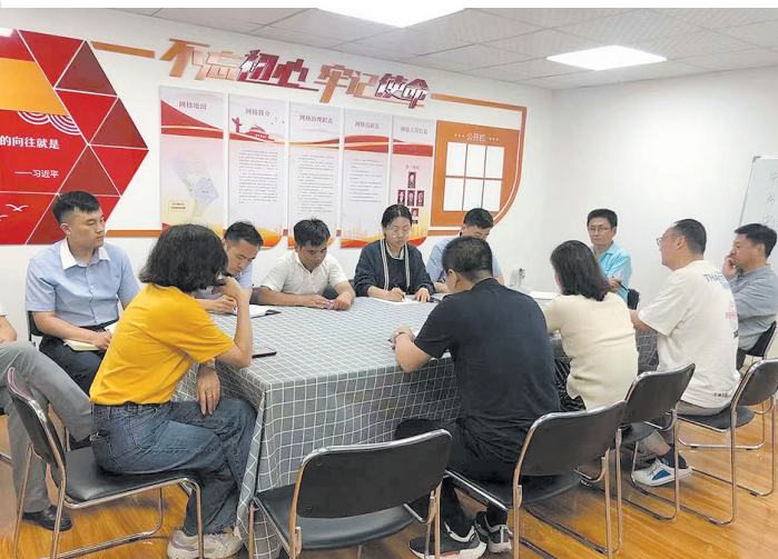
■小区党支部牵头召开了多方联席会议,共同对花园的修复、验收等全过程进行深入细致的研讨。