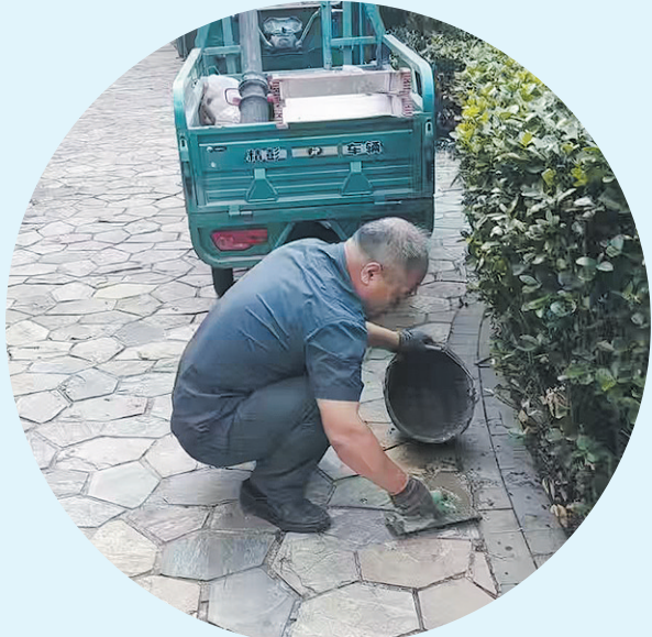
■龙湖物业和园区美化提升小组成员维修小区路面。