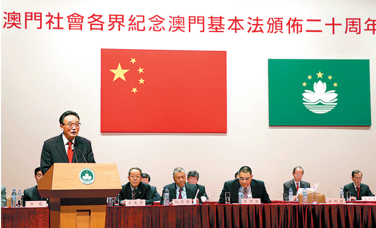
澳門社會各界紀念澳門基本法頒佈二十周年