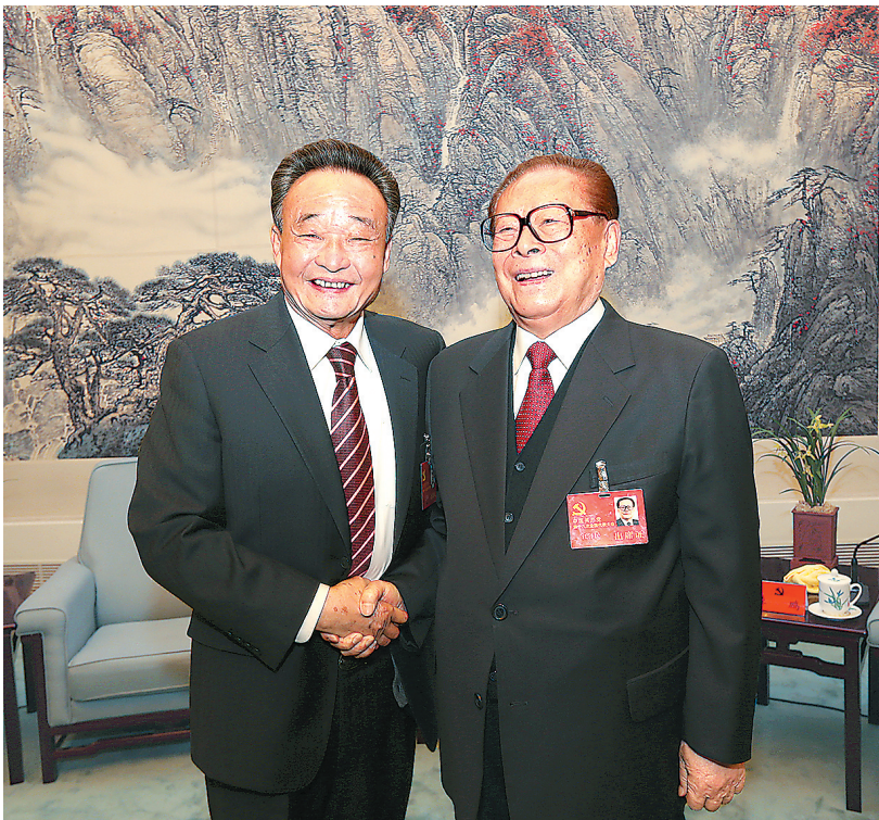
■上图:2012年11月14日,中国共产党第十八次全国代表大会在北京闭幕。这是闭幕会前,江泽民同志与吴邦国同志在一起。