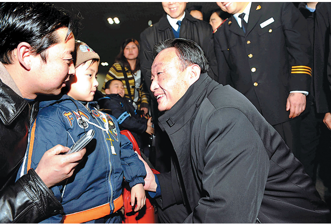
■左图:2008年2月3日,吴邦国同志在北京西站候车室与旅客交谈。