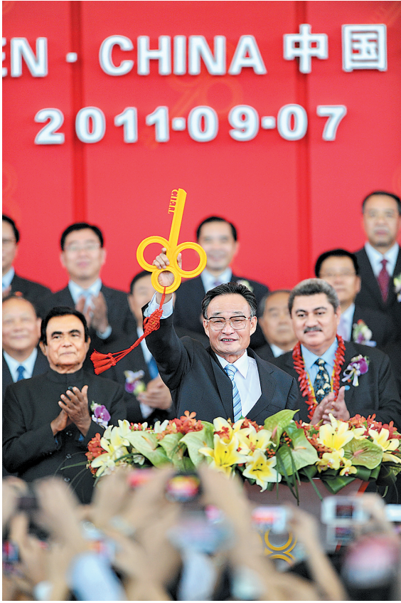
■左图:2011年9月7日,吴邦国同志在福建厦门出席第十五届中国国际投资贸易洽谈会开幕式。