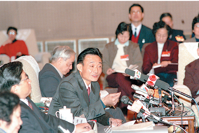
■左图:1994年3月,时任上海市委书记的吴邦国同志在全国两会上海代表团全团会议上。