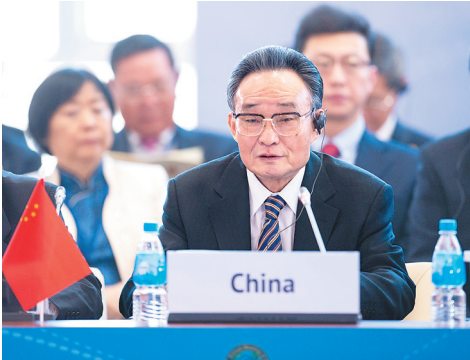
■上图:2013年1月28日,吴邦国同志在俄罗斯符拉迪沃斯托克出席亚太会议论坛第21届年会,并作题为《坚持和平发展 促进合作共赢》的主旨发言。