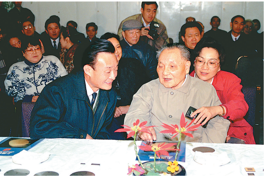
■上图:1992年2月10日,邓小平同志在上海贝岭微电子科技有限公司参观时与吴邦国同志交谈。