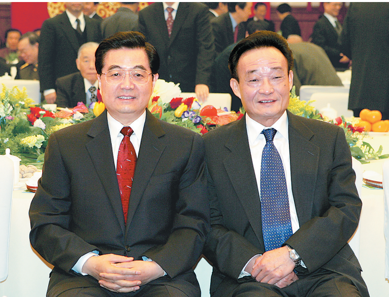
■左图:二〇〇五年一月一日,全国政协在举行新年茶话会。这是胡锦涛同志与吴邦国同志在一起。