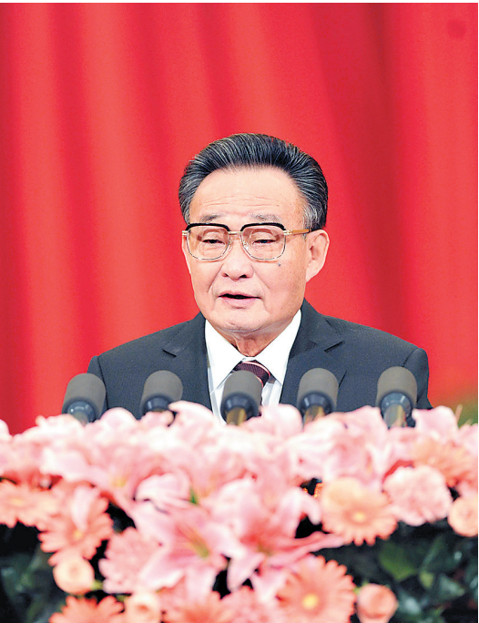
■左图:2011年3月10日,十一届全国人大四次会议在北京人民大会堂举行第二次全体会议。吴邦国同志作全国人民代表大会常务委员会工作报告。