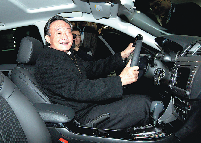
■左图:2010年1月30日,吴邦国同志在上海汽车集团股份有限公司技术中心察看新能源样车。