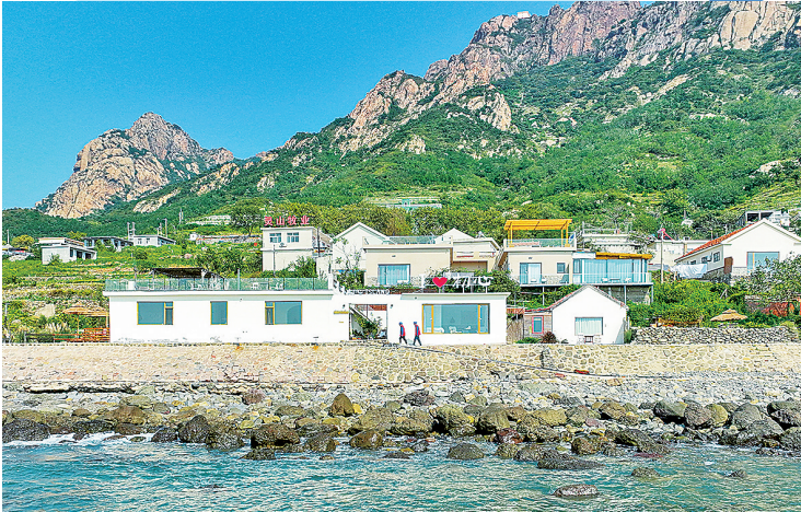
■国网山东青岛供电公司员工在灵岛岛对民宿、渔家宴等用户开展安全用电检查。