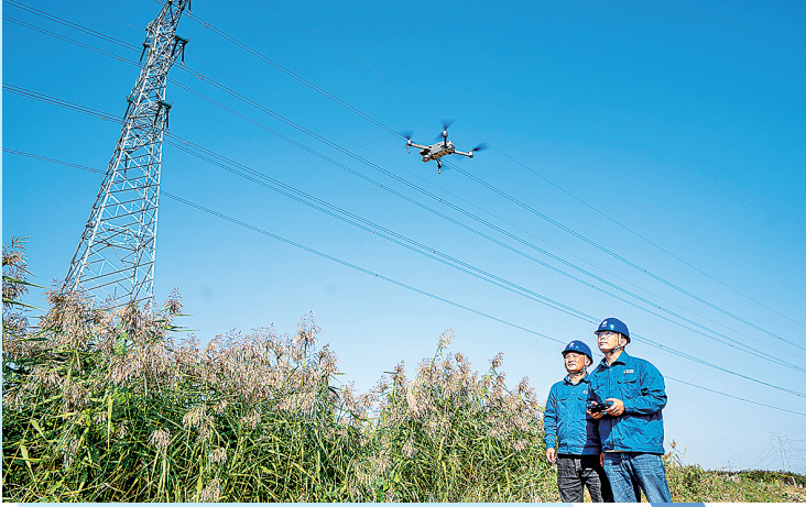
■国网山东青岛供电公司员工采用无人机巡检方式对运行线路开展巡视巡检。

具体来说，集中式新能源“并得快”，开展“清风暖阳”行动，“十四五”期间助力13座集中式新能源项目并网发电，并网效率提升30%；分布式光伏“并得多”，推广分布式光伏“整村开发、汇流升压”“分布式光伏+储能”