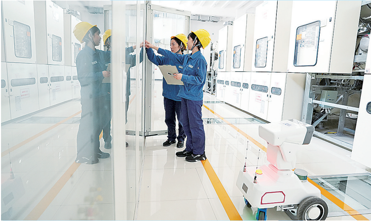
■国网山东青岛供电公司员工采用“人巡+机巡”的方式对重点变电站开展日常巡视。