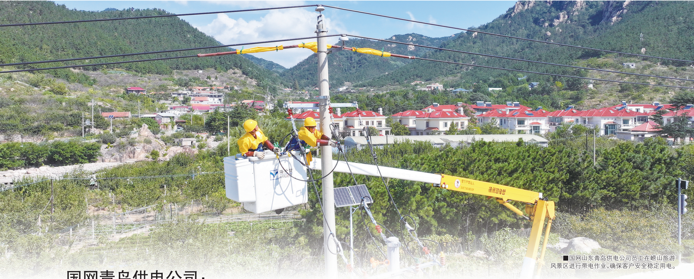
■国网山东青岛供电公司员工在崂山旅游风景区进行带电作业，确保客户安全稳定用电。