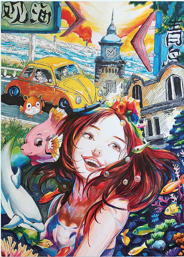
《观海青岛之美》 舒世栋 青岛市第六中学