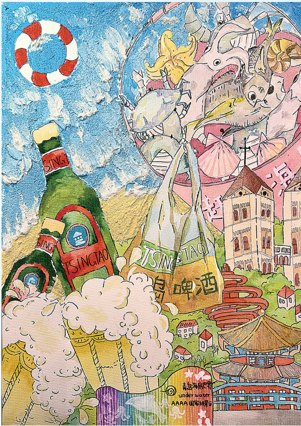
《繁华青岛、简单生活》 谢润儿 青岛大学附属中学