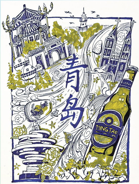
《春见岛城》 蔡佳睿 青岛市崂山区实验初级中学