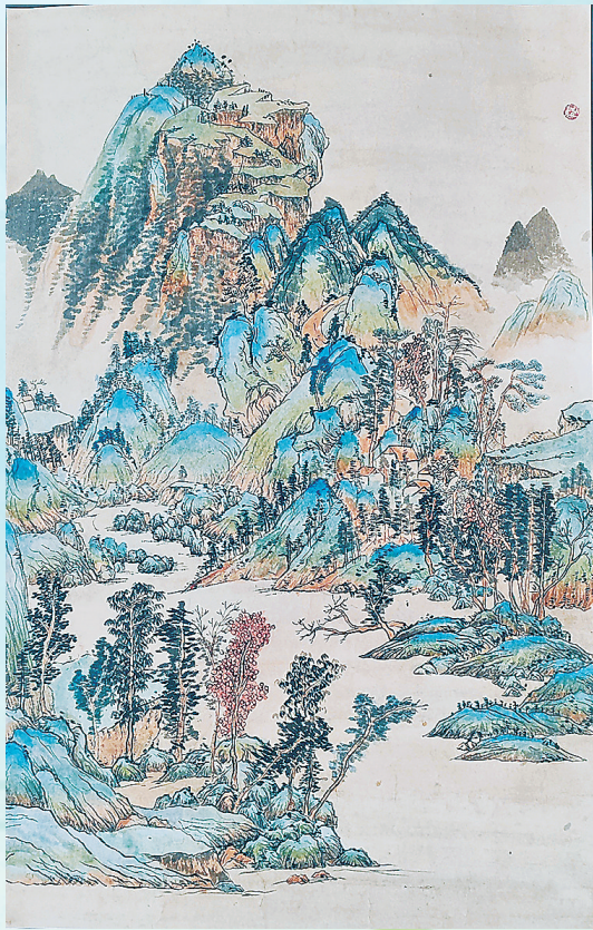
《青岛之青山绿水》 王月涵 青岛沧口学校