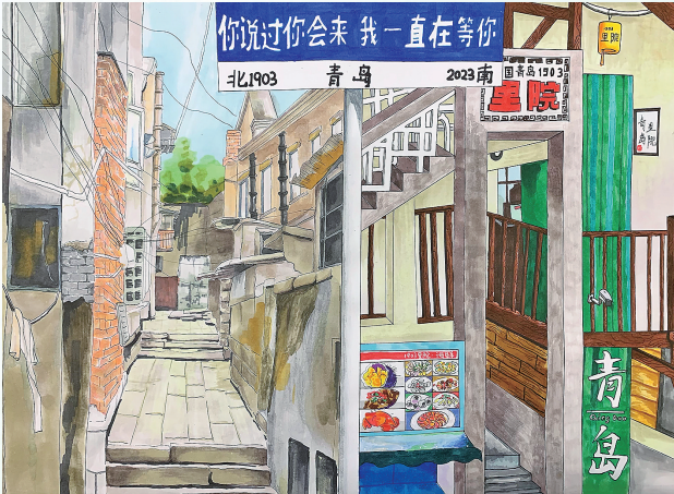
《里院的变迁》 刘安琪 青岛弘毅中学