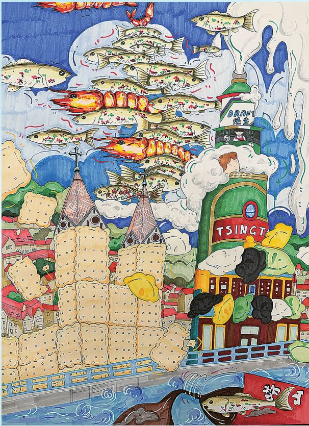
《食全市美》 明月 青岛市南京路小学