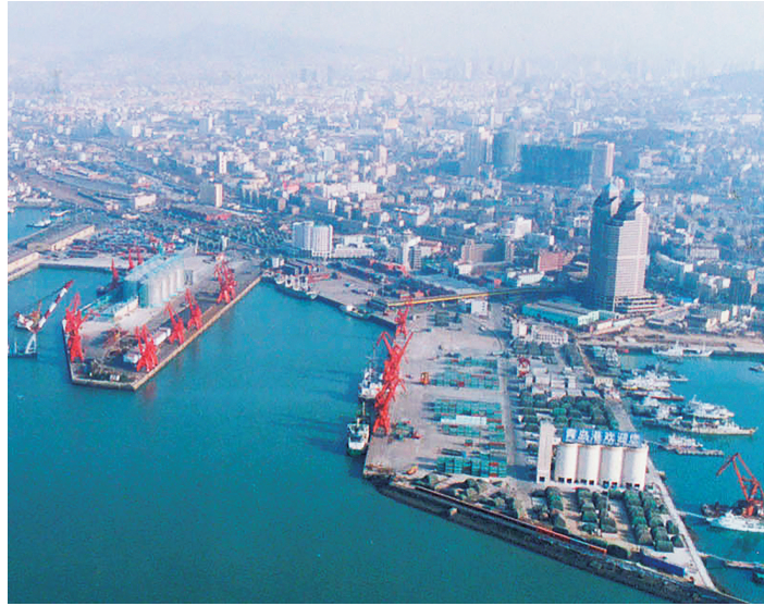
后海沿岸的6号码头（摄于2008年）。