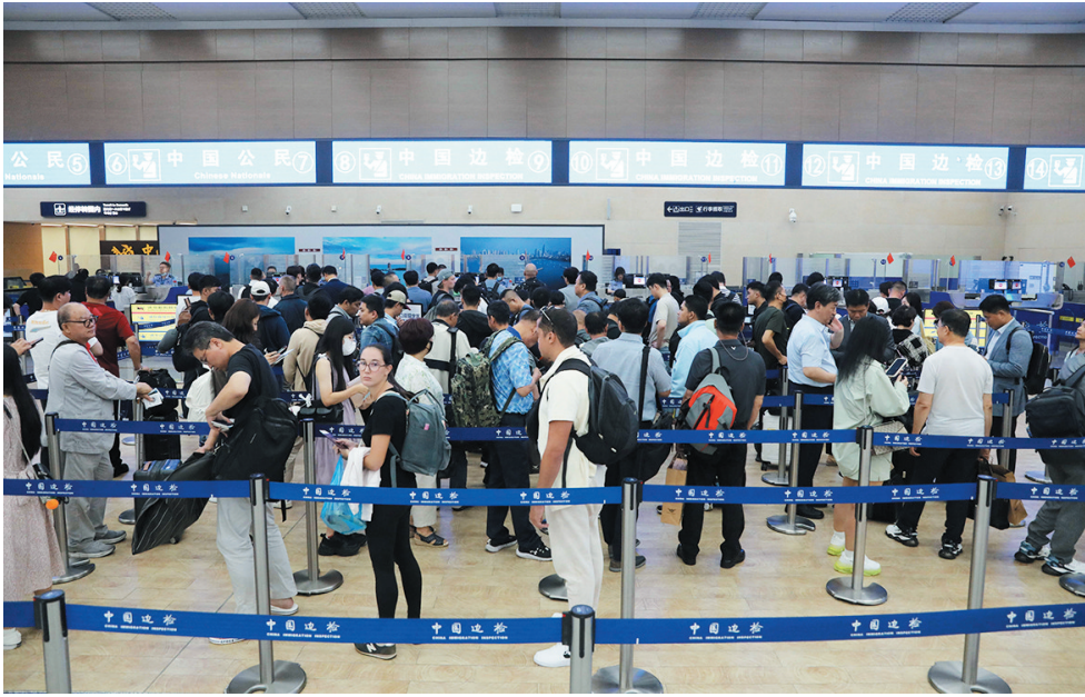
■青岛机场口岸入境外籍人员呈现明显增长趋势。图为外籍旅客正在办理通关手续。

“China travel”(中国旅行)走红网络,吸引了越来越多的外国人来华旅游;国家移民管理局各项便利中外人员往来政策红利不断释放……在多种因素的共同影响下,青岛机场口岸入境外籍人员也呈现明显增长趋势。作为“上合组织旅游和文化之都”和国际滨海旅游目的地,青岛成为外籍人士“China travel”的重要入境口岸。据统计,今