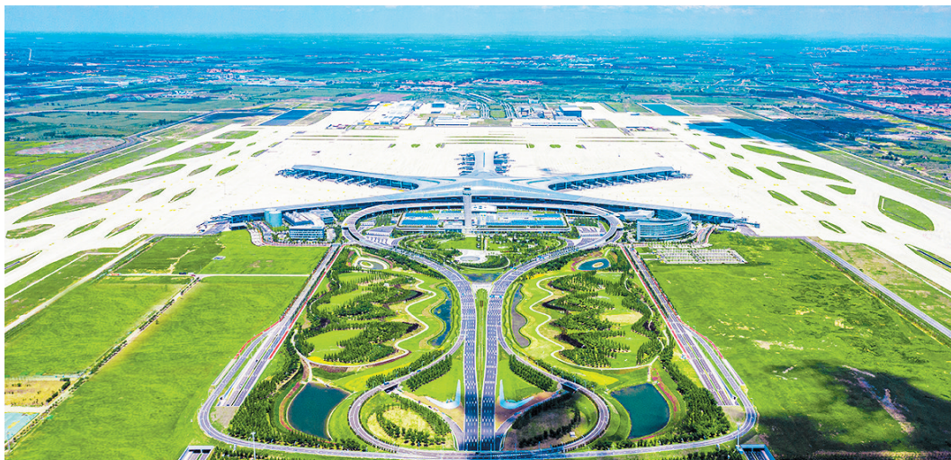
►青岛胶东国际机场启用后,成为省内首座4F级国际机场。