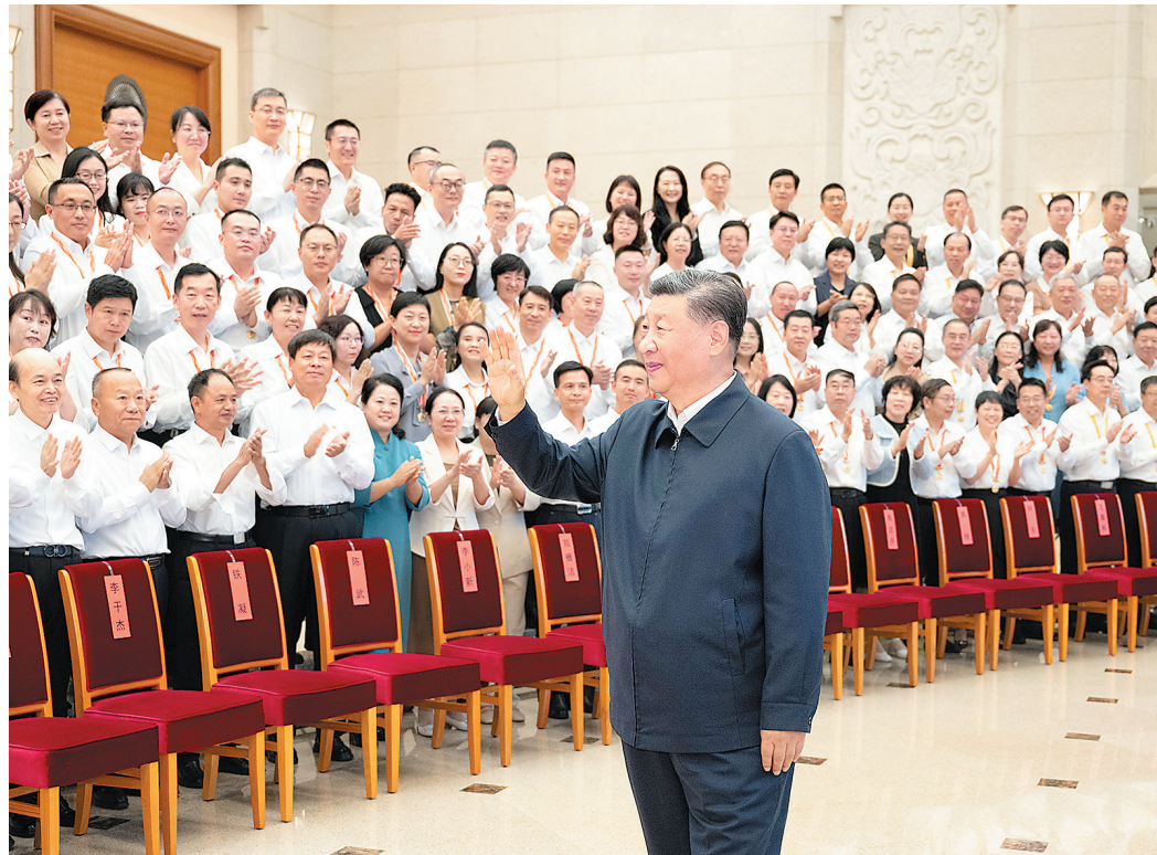
9月9日,党和国家领导人习近平、李强、蔡奇、丁薛祥等在北京接见参加庆祝第四十个教师节暨全国教育系统先进集体和先进个人表彰活动代表。