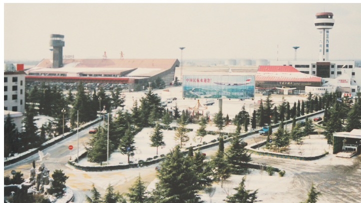
▲上世纪90年代的青岛机场全貌。