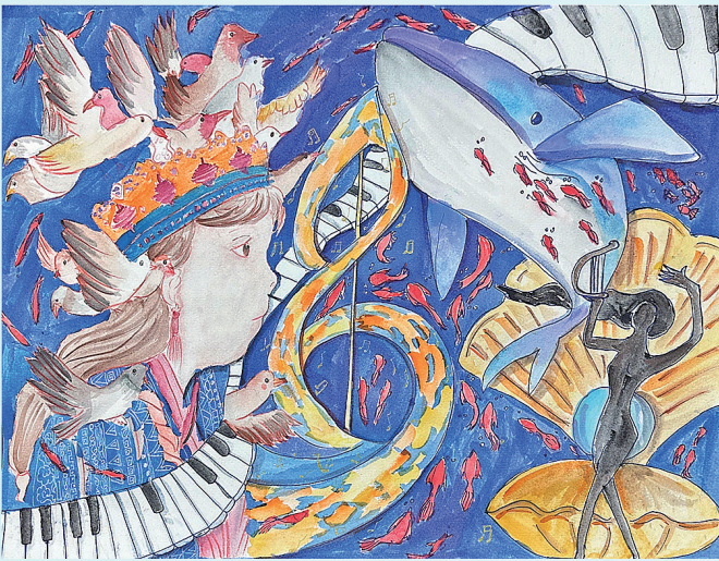
《倾听海浪的旋律》 翟亦奇 青岛崂阳学校