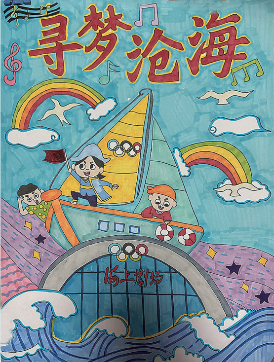
《寻梦沧海》 陈莹宇 青岛新昌路小学