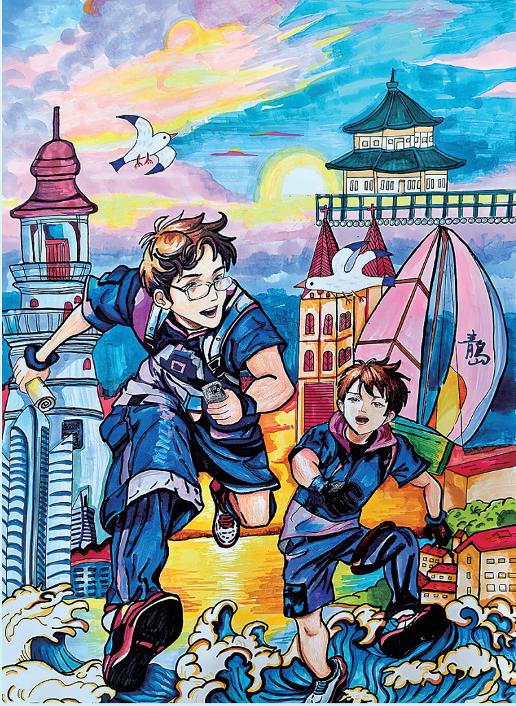
《梦·游青岛》 方晨宇 青岛超银中学