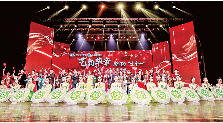
▲青岛电子学校、平度师范学校举行“艺韵华章·我们的‘十个一’”美育成果汇报演出。

“一长两校”之后，平度师范学校开始逐步提高学校的治理水平和治理能力。比如，在推荐教师参评省市荣誉时，平度师范学校参考电子学校教职工考核方案的思路，科学制定了推荐办法，精准高效地完成了人选推荐，一改往日推举工作缓慢、争议较多的局面。今年8月，两位教师顺利获评2024年度青岛市中小学优秀班主任荣誉。