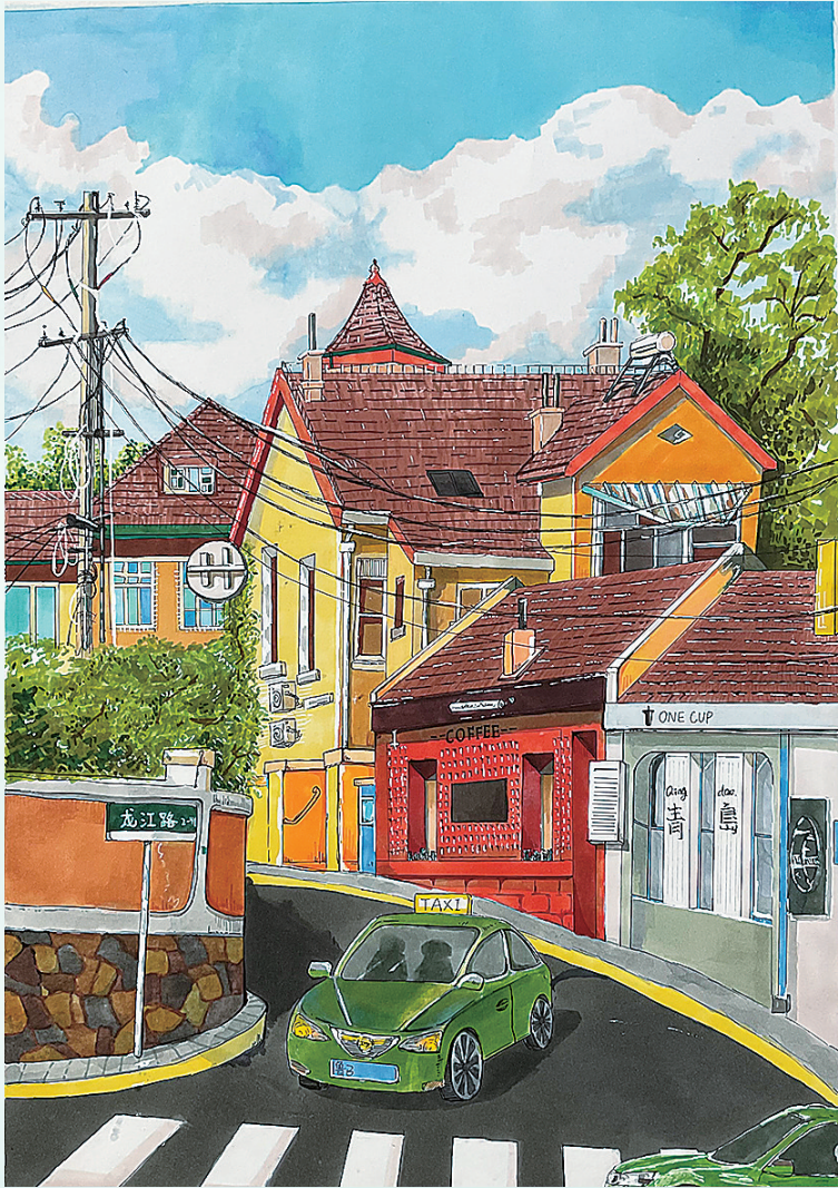
《老城青岛》 杨果果 青岛第六十五中学