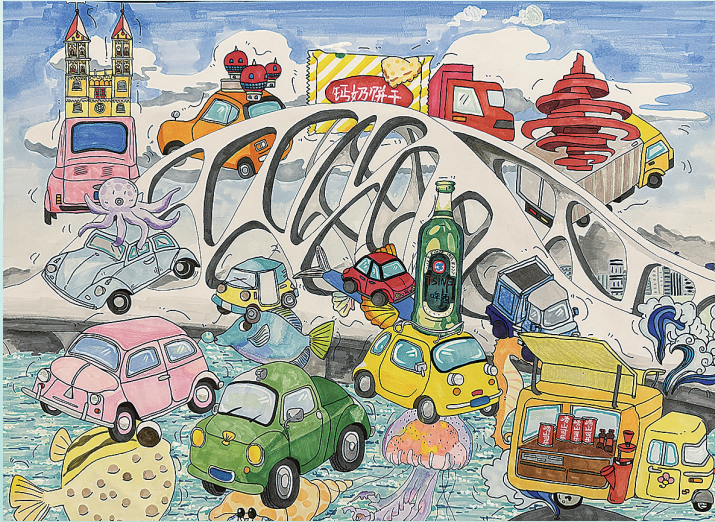
《飞跃贝壳桥的神奇汽车》 陈娅维 青岛镇江路小学