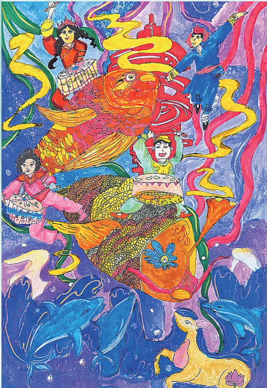
《斑斓青岛 彩浪之舞》 孙锦轩 青岛延安二路小学