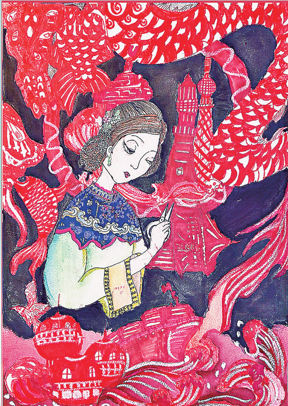
《“纸”此青岛》 申熠彤 青岛贵州路小学