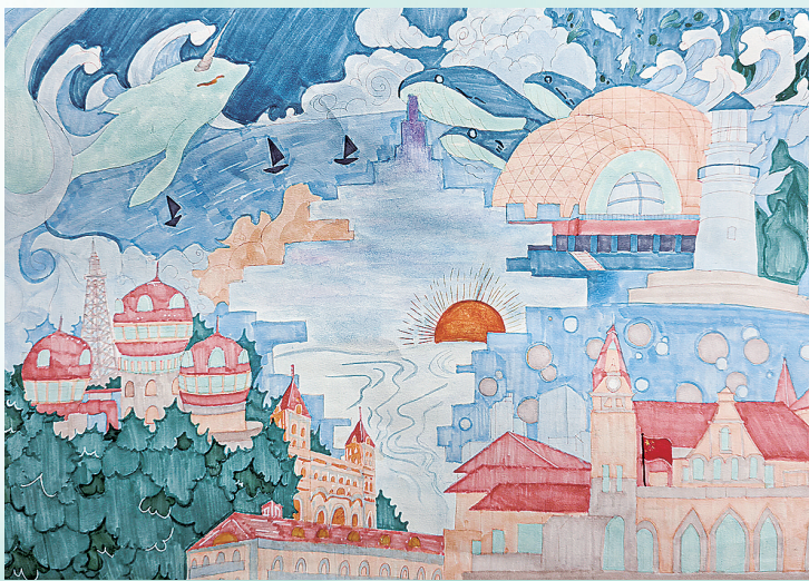
《青岛印象》 刘凝东 青岛第七中学