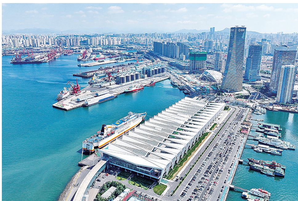
■6号码头如今已成为青岛邮轮母港客运中心。