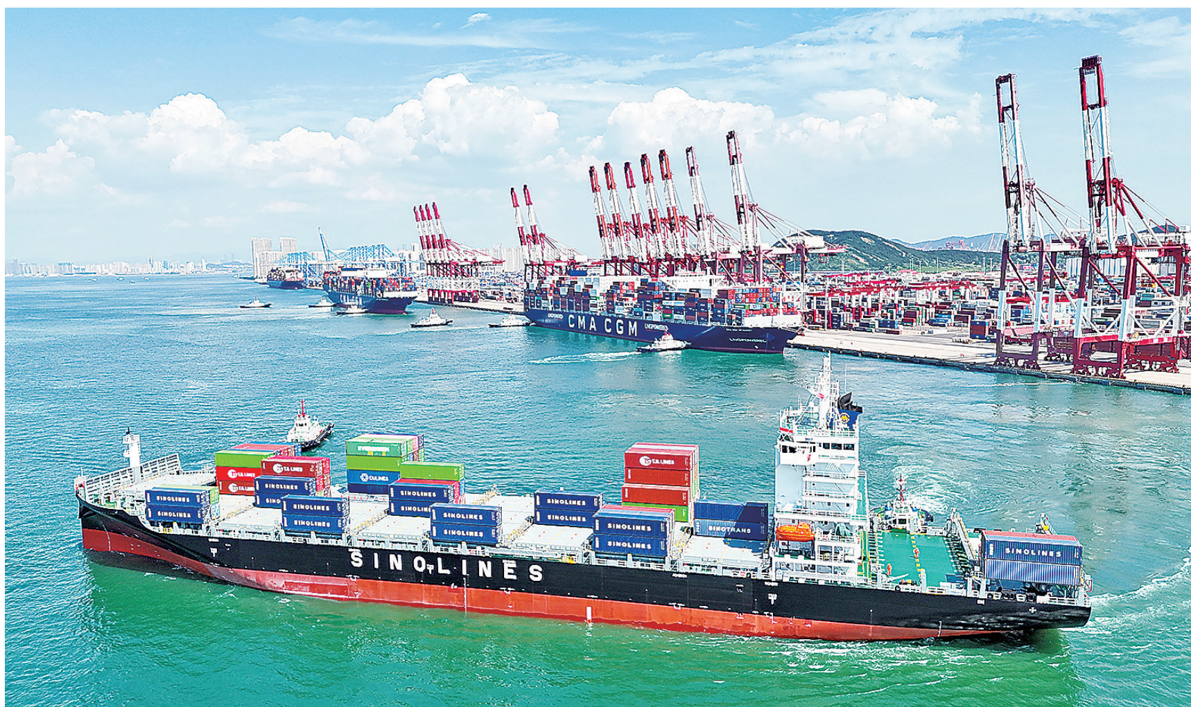
■如今的前湾港已是可靠泊世界最大集装箱船舶的综合性港区。