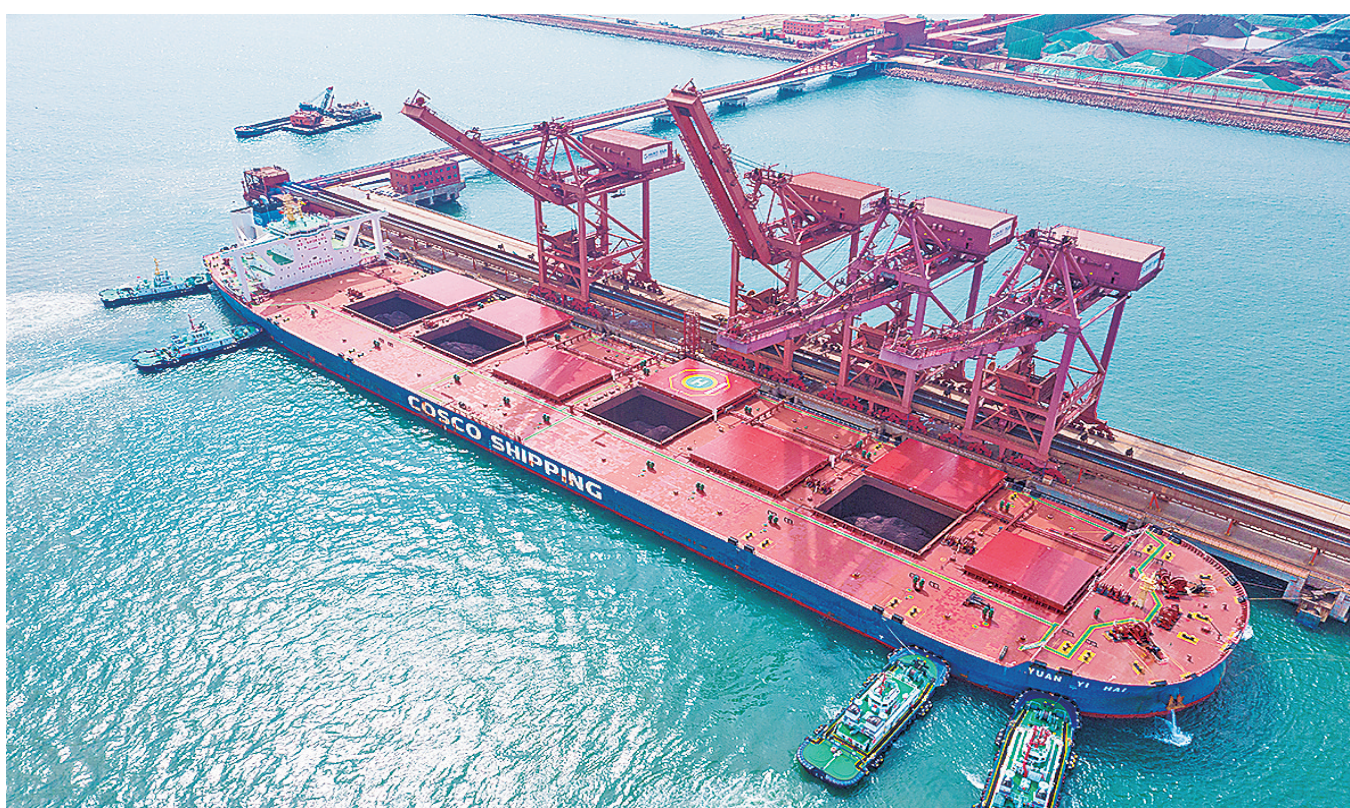
■大型货轮在董家口港区接卸矿石。