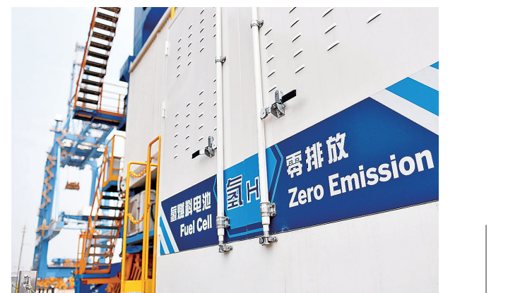
■我国首个全场景氢能港口正在加紧建设。