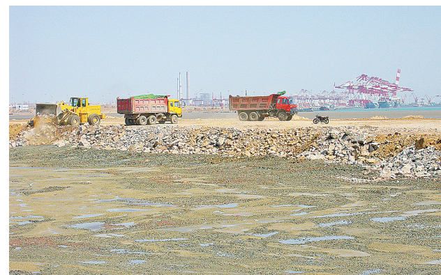
■正在建设中的青岛前湾港(摄于2005年)。张岩 摄