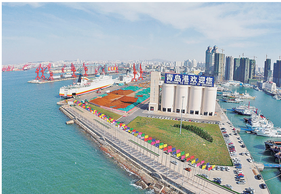
■2008年时的6号码头。

巨型桥吊林立, 400米大船频靠, 集装箱、原油、矿石、橡胶等货种大进大出……在山东港口青岛港, 这样忙碌的生产场景日夜不息, 连接起全球产业链、供应链, 展现着青岛外向型经济的活力与韧性。