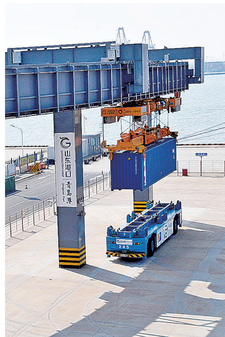
■山东港口青岛港智能空轨集疏运系统正在运行。