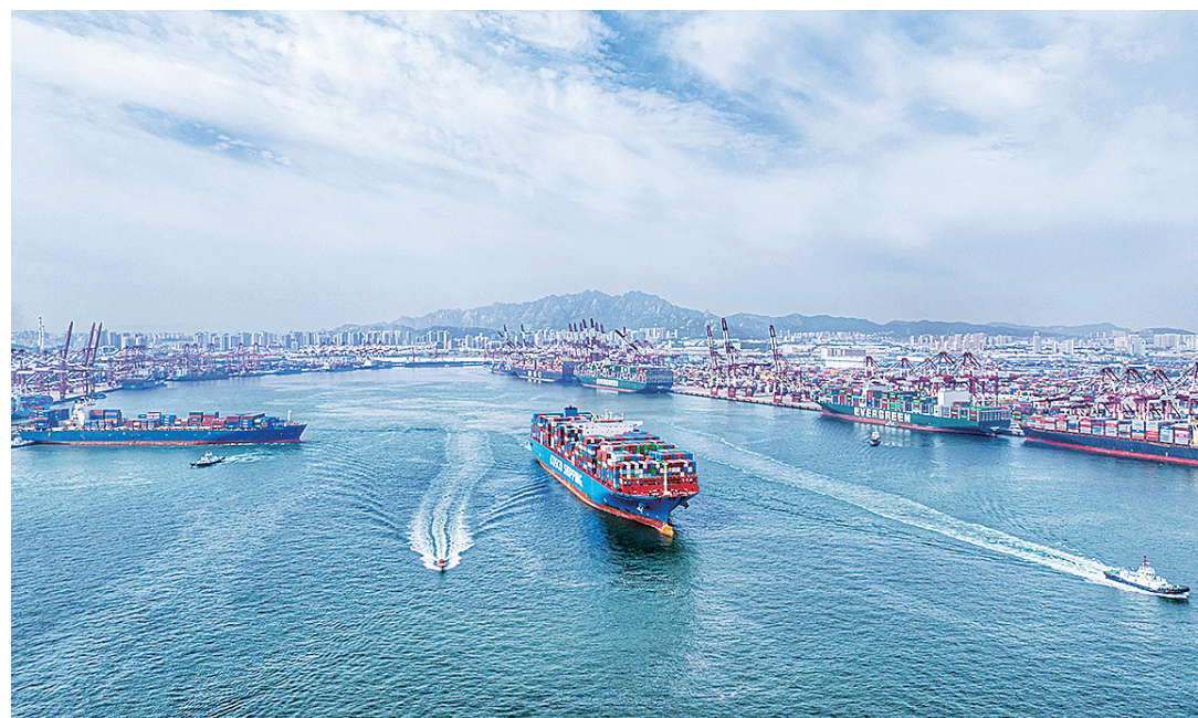
▲20世纪90年代,1号码头堆满矿石和钢材。