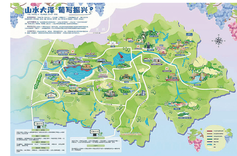
■大泽山文旅手绘地图。

泽山镇坚持链式推进，持续打造功能全、韧性强、质量稳、效率高的供应链，实现了产、销、储“全面升级”。在做好葡萄初深加工上，为走出葡萄原料供应的下游地位，依靠地理标志品牌的影响力和传播效应，大泽山将市场需求传导到生产、加工、销售各环节，大力发展葡萄产业的新业态，发展一批具有一定规模的葡萄酒研究所，先后开发了冰葡萄酒、鲜葡萄汁、葡萄酒醋等系列新产品。在做好物流仓储上，形成“冬棚葡萄+春棚葡萄+露天葡萄+冷库葡萄”的全季节性葡萄产业链，年均周转储存时令葡萄7000吨，拉长鲜食葡萄供应时间，年可增加收入1800万元。利用“政府+合作社+企业”的合作模式，与商超、电商平台、社区团购建立物流销售专线，实行葡萄订单管理及购销，如年均通过各电商平台销售葡萄200余万斤，让大泽山葡萄“枝头直抵舌头”。