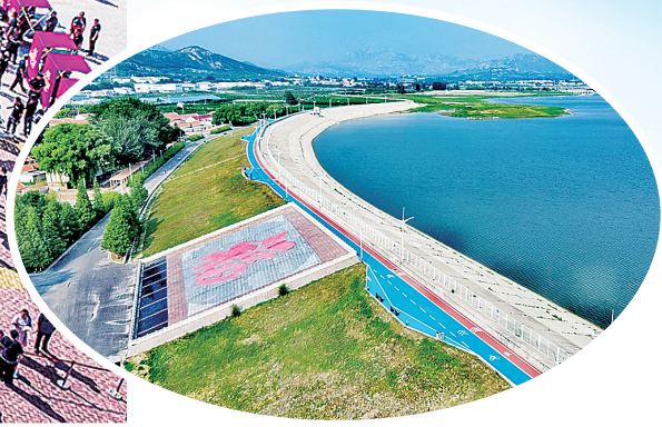
▼大泽山镇淄阳湖健身步道。