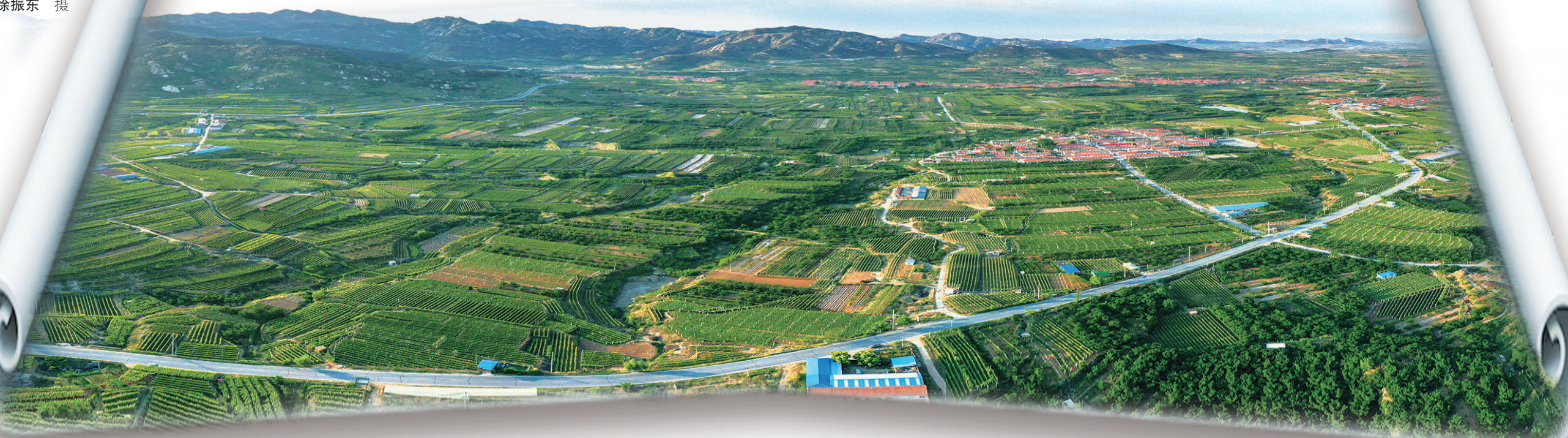
■大泽山镇万亩葡萄郁郁葱葱展丰收画卷。