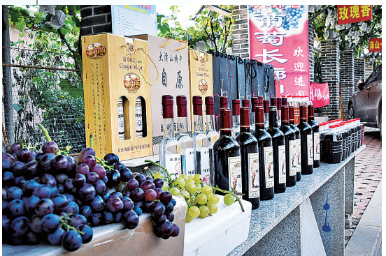
■大泽山镇葡萄深加工产品。