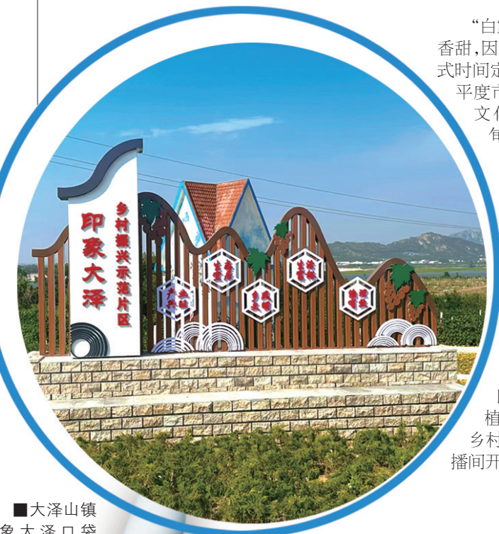
■大泽山镇印象大泽口袋公园。