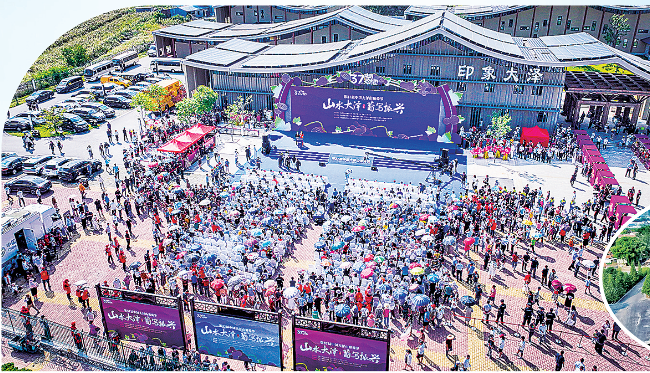
▲第37届大泽山葡萄节现场人山人海。