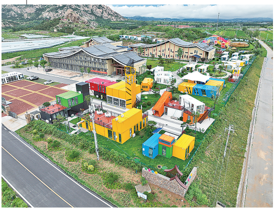
■印象大泽·集装箱部落项目航拍。