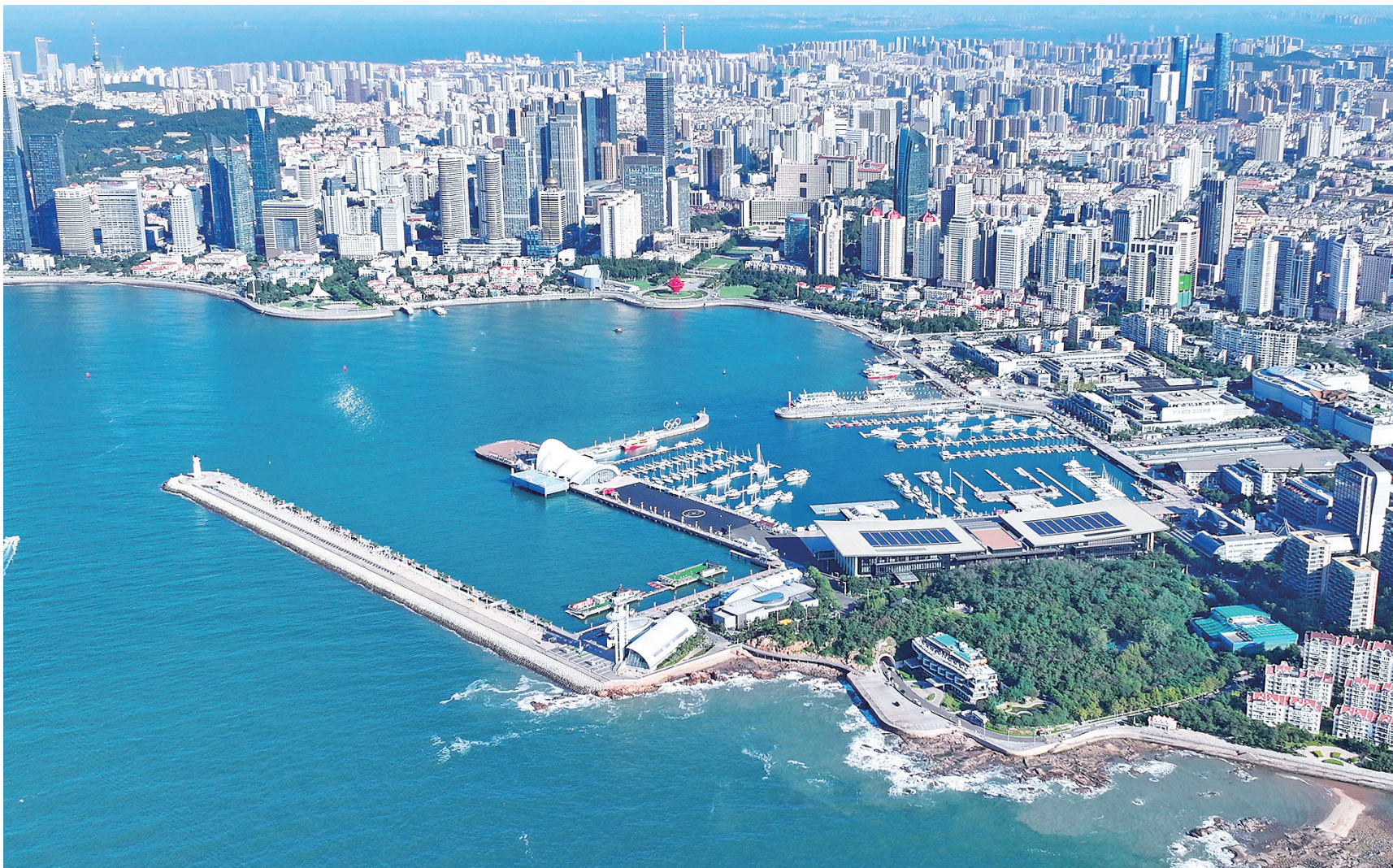
■如今的浮山湾畔呈现出现代化国际大都市风貌。