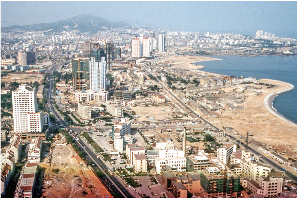
■1994年,建设中的东部城区。