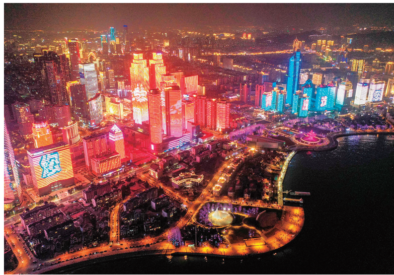
■浮山湾畔灯光秀。