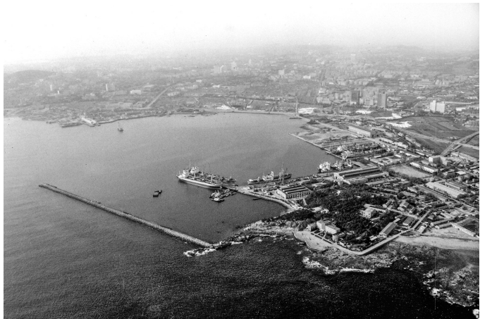
■1989年,浮山湾沿岸农田遍地。