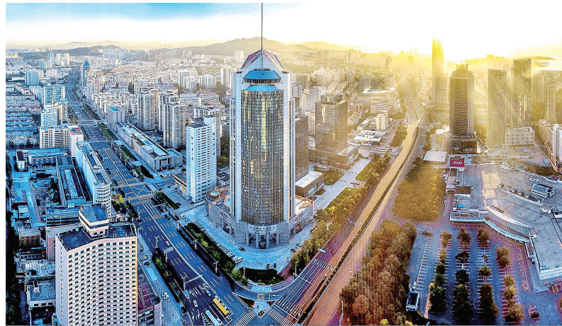
■位于香港中路的青岛金融街。