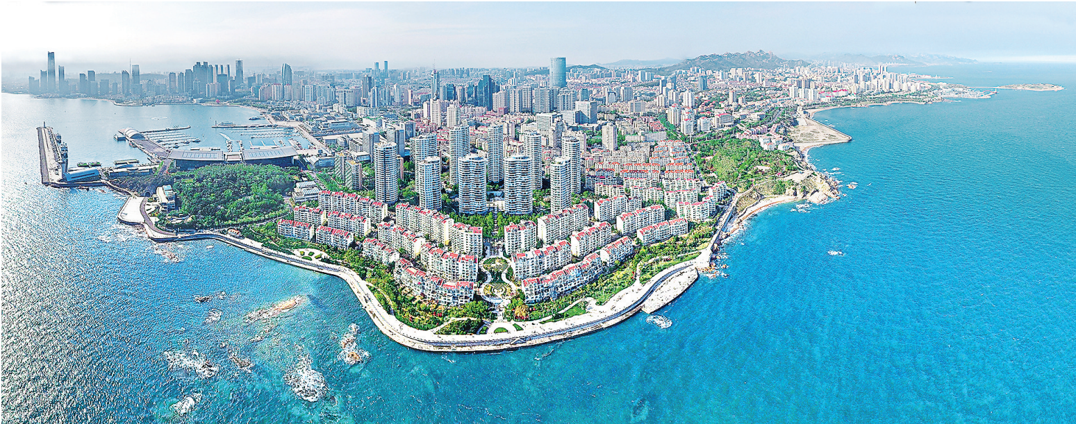
■东部城区环境不断提升,变得更加宜居、宜业、宜游。