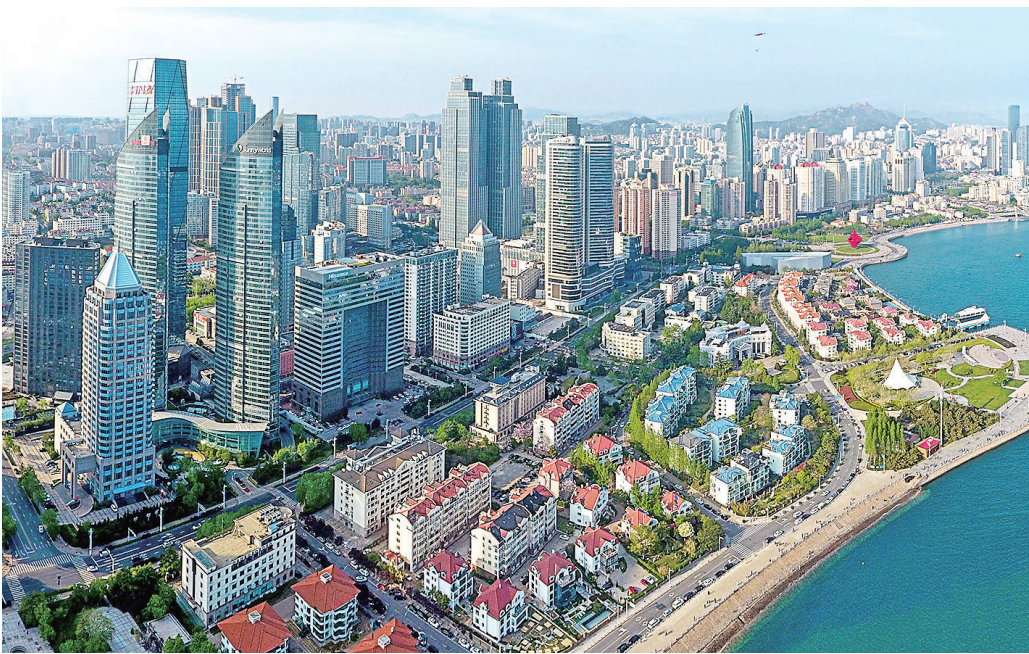
■现在的东部城区高楼林立。