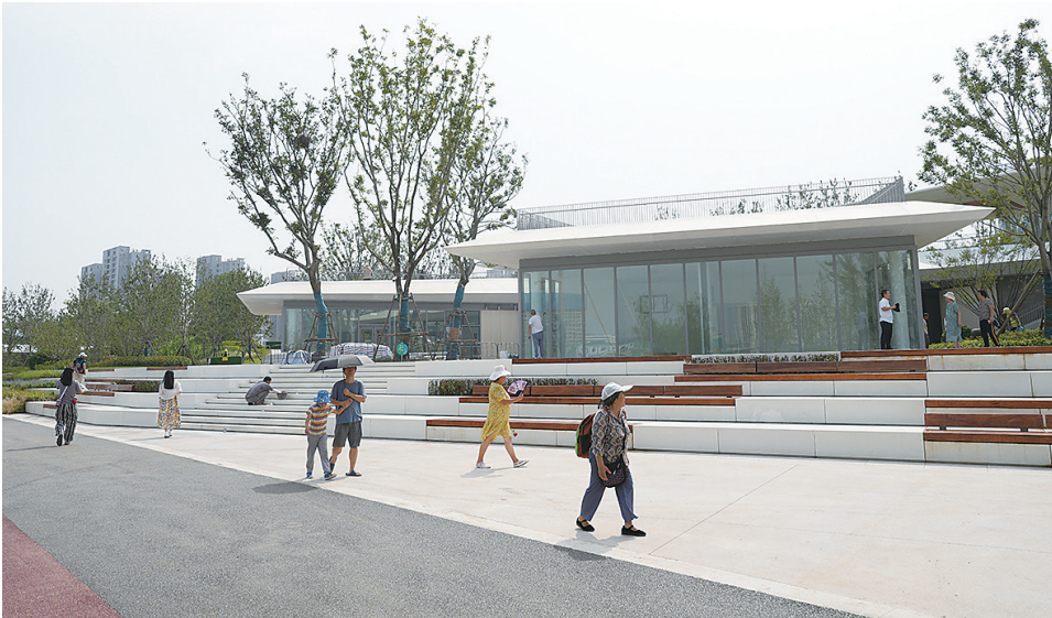
■张村河生态修复和环境整治提升一期工程先行启动区试开放，吸引了众多市民前来一睹为快。