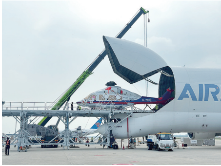
■正在进行卸货作业的“大白鲸”运输机。

□青岛日报/观海新闻记者 周建亮 本报9月1日讯 1日凌晨1点52分，空中客车“大白鲸”运输机平稳降落在青岛胶东国际机场。这是该机型首次落地青岛，也是空客公司旗下白鲸运输公司取得航空运输企业经营许可证后首次执行飞往中国的运输任务。据悉，本次“大白鲸”运输的货物为2架进口H175型直升机，由法国图卢兹布拉克机场起飞，经长途跋涉后抵达青岛胶东国际机场。 空中客车“大白鲸”运输机在全球仅有五架，由于独特的造型与鲸豚相似，因此获得了“大白鲸”这个昵称，常用来运输飞机大型组件等超大尺寸货物。