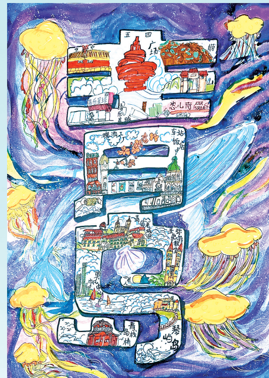
《奔赴山海》隋安 青岛大学路小学