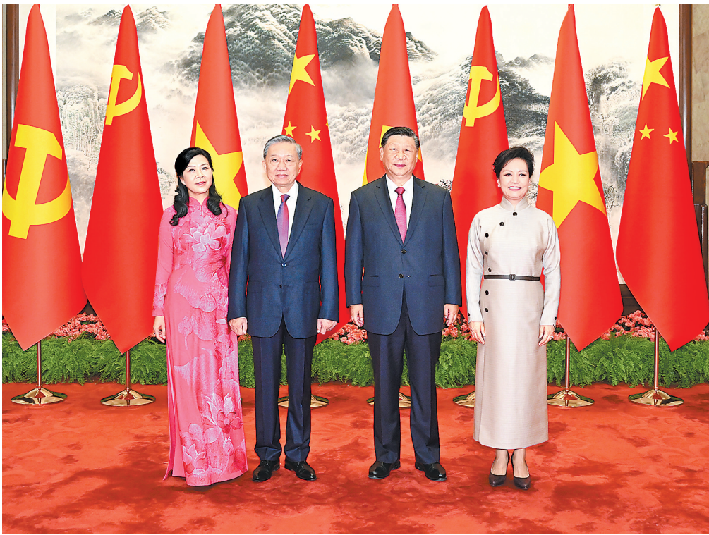
8月19日,中共中央总书记、国家主席习近平在北京人民大会堂同来华进行国事访问的越共中央总书记、国家主席苏林举行会谈。这是会谈前,习近平和夫人彭丽媛同苏林和夫人吴芳璃合影。

新华社北京8月19日电 8月19日,中共中央总书记、国家主席习近平在北京人民大会堂同来华进行国事访问的越共中央总书记、国家主席苏林举行会谈。