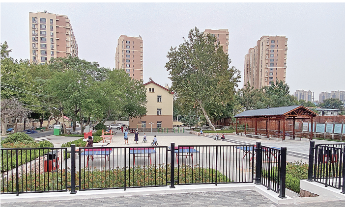
■改造一新的老旧楼院焕发新活力。