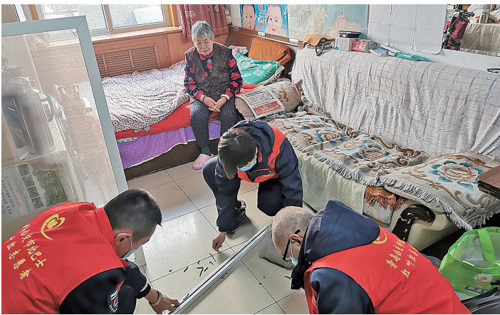
■开平路街道党员先锋队上门为居民维修纱窗。