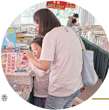
■“阅见美好·书香市北”惠民书市场。