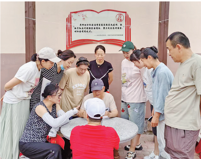
■正一康居小区党支部带领业主讨论小区改造方案。