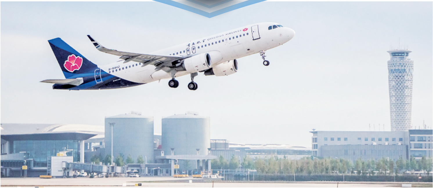
■今年7月9日,青岛至吉隆坡首条直航航线开通。

上半年数据: 青岛机场日韩航线累计执行航班8282架次,完成旅客吞吐量89.85万人次,同比分别增长128.3%、240.4%,日韩门户枢纽功能进一步增强