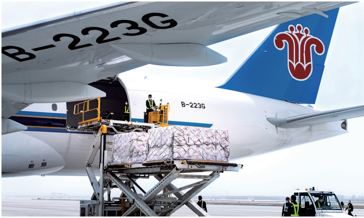
■今年7月7日起,青岛至多伦多货运航线由每周3班加密至每周4班。