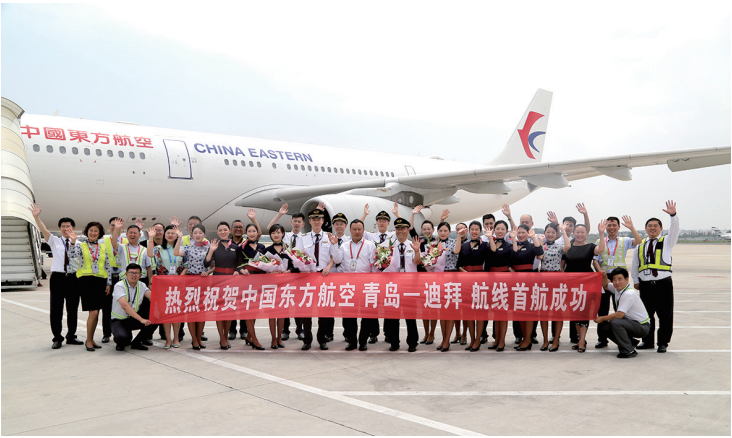
■2019年6月,由东方航空执飞的青岛—迪拜航线开航。