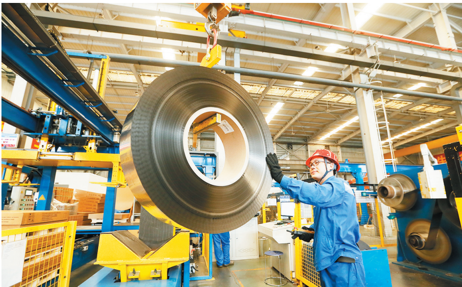
青岛云路先进材料技术股份有限公司的工人在生产出口到海外市场的非晶带材。

作为国内最早提出引导中小企业走专精特新发展道路的城市,青岛已累计培育6835家专精特新中小企业、190家国家级专精特新“小巨人”企业,数量均位居全省第一。专注大气及海洋探测激光雷达的镭测创芯,为航天工程配套高精度传感器的智腾微电子,打造船舶绿色氢氨醇一体化项目的海德威,创造行业内充电桩单车充电功率最高纪录的海汇德……正是在这些貌不惊人但都拥有“独门绝技”的企业里,蕴藏着未来产业勃兴的种子。无论是从谋划城市未来发展的角度,还