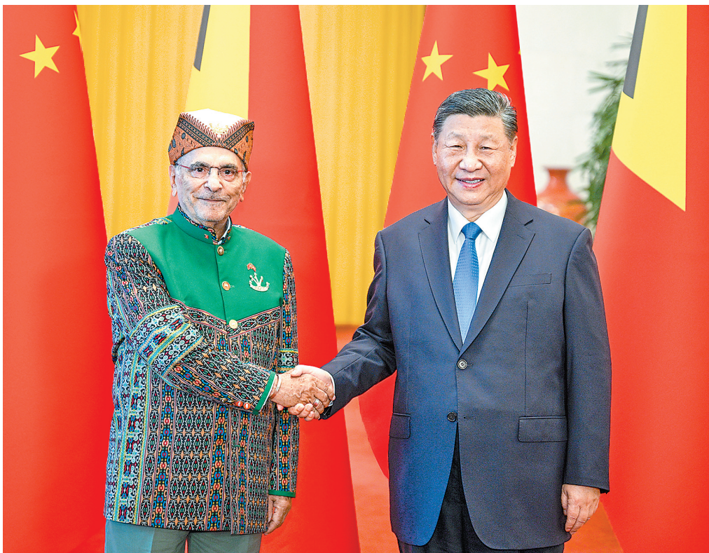
7月29日上午,国家主席习近平在北京人民大会堂同来华进行国事访问的东帝汶总统奥尔塔举行会谈。这是习近平同奥尔塔握手。

习近平强调,中方愿同东帝汶一道,朝着“三个更高”的目标,引领双边关系长期稳定发展。一是坚定相互支持,打造更高水平双边关系。中方坚定支持东帝汶维护国家统一和社会稳定的努力,愿同东帝汶全面深化战略协作和发展合作,维护好两国主权和安全利益,朝着共建命运共同体的大方向迈进。二是坚持互利共赢,开展更高质量务实合作。围绕产业振兴、基础设施建设、粮食自给、民生改善等四大重点领域合作,以签署共