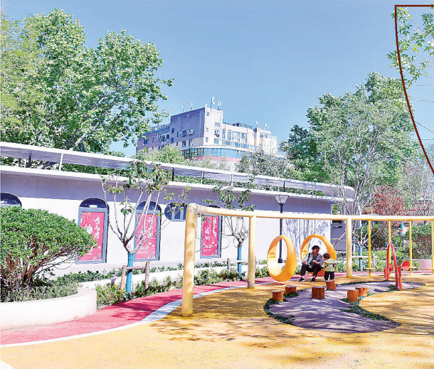
■兴隆路街道利用“微更新”提升小区周边环境，图为改造后的嘉禾路18号口袋公园。

今年以来，市北区兴隆路街道全力推进老旧小区改造更新、品质打造及环境提升，系统化解居民反映强烈的难点堵点问题；建立“自治小组+微网格+社区党组织”的沟通机制，为居民创造更加和谐、宜居的生活环境；打造“红动兴隆·情联万家”惠民服务品牌，提升文化服务效能，让居民乐享新生活。