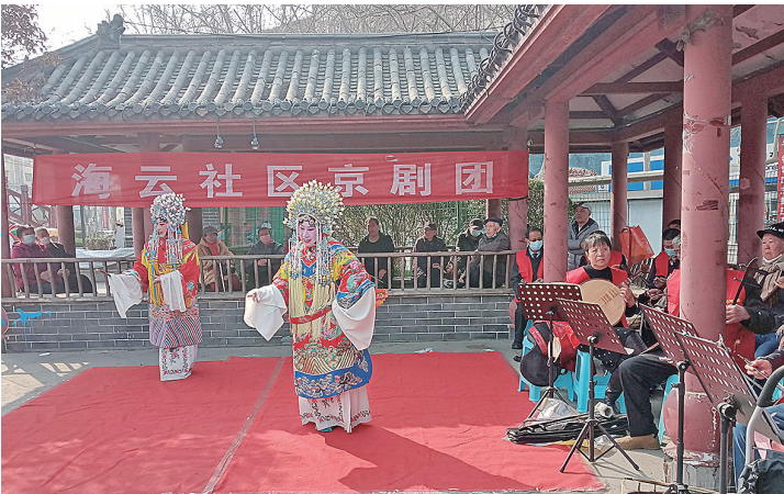
■海云社区京剧团参加“文化进万家”群众文化艺术节展演。