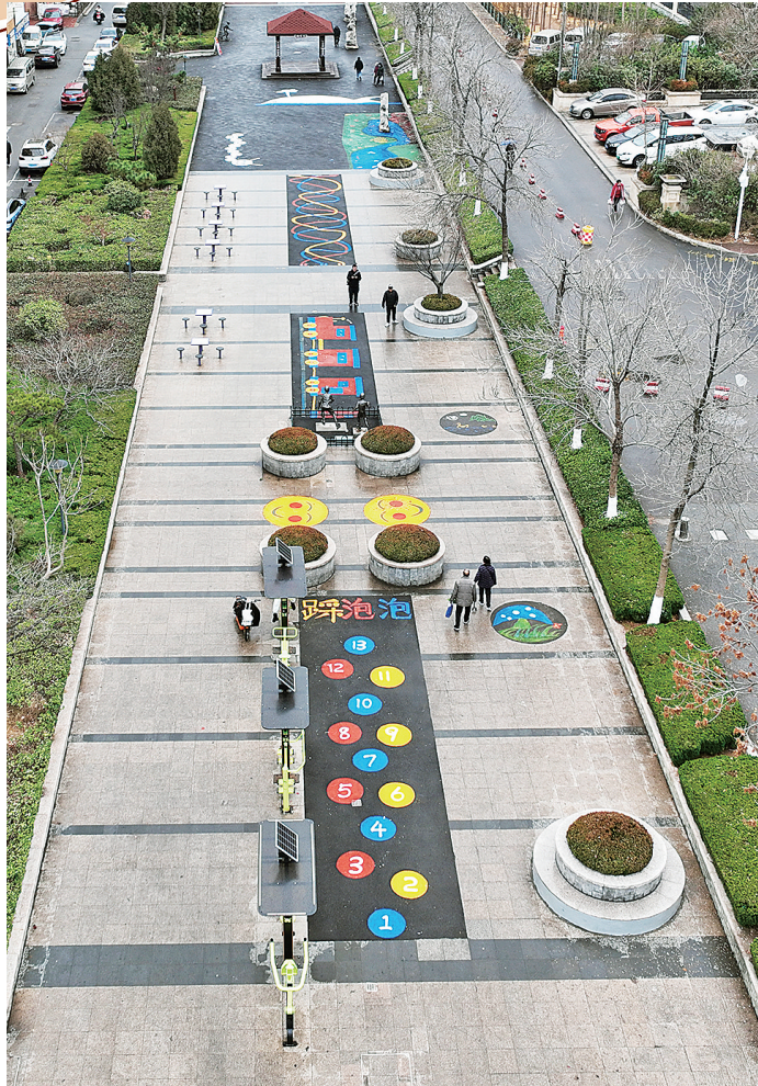
■海岸路体育街经过“微更新”改造后，成为别具特色的“地面乐园”。