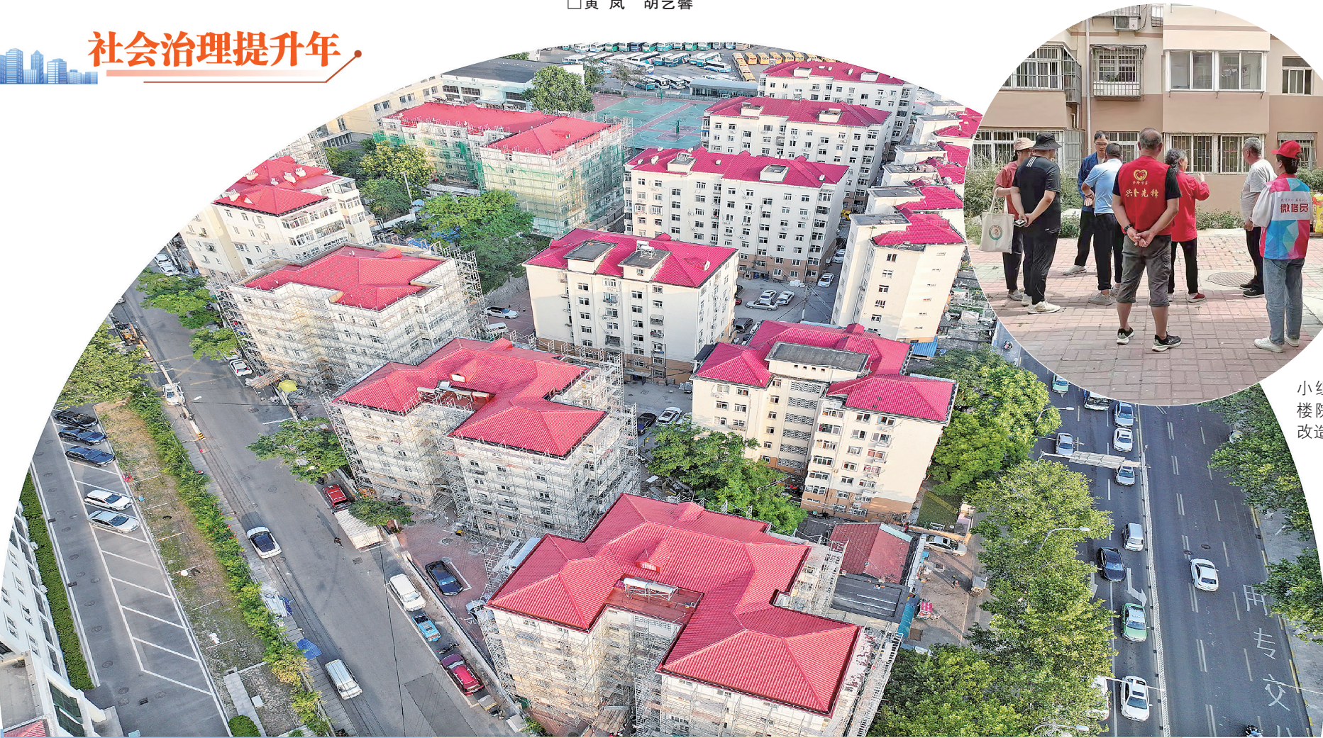
■街道“自治小组”实地走访老楼院，征集居民对改造的意见。