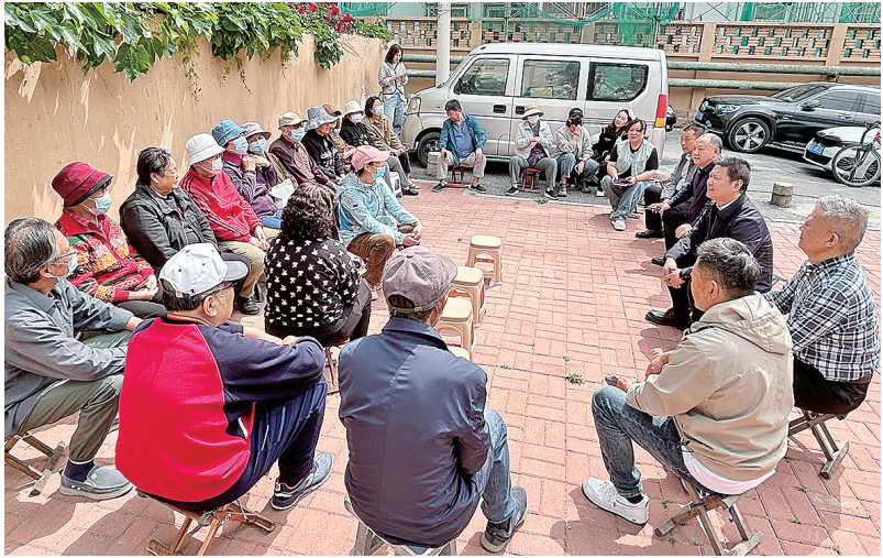
■居民们参加兴隆路街道的“马扎议改”民意监督会。

市北区档案馆是国家绿建新标准实施后的全国第一家绿建三星综合档案馆建筑。《新技术新理念在绿色档案馆建筑中的探索与实践》主要记录了市北区档案馆积极落实“双碳”行动，按照国家绿建三星标准设计规划，从而有效节约运营成本、降低能耗的成功经验，具有良好的社会效益和经济效益。《“聚和荣光”市北区非凡十年成就展》举办于市北区经历新一轮划调整十周年之际，展期120天，展出照片260幅、实物40余件、视频文件10部，接待社会各界4800余人次参观。(张韦涵)