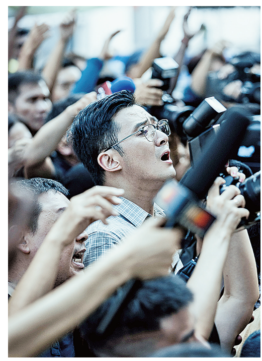
■电影《默杀》中饰演“杨老师”的沈浩。