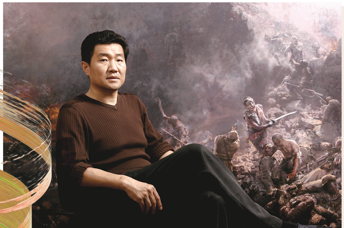
■新晋当选的山东省文联主席徐青峰。

7月4日上午,山东省文学艺术界联合会第十届委员会第一次全体会议召开,选举产生新一届领导机构,徐青峰当选山东省文联主席。在新起点新征程上,这位从青岛走出的艺术家,不仅以精品力作回应时代呼唤,更以深耕齐鲁人文沃土的新文化使命担当,推动齐鲁文艺再攀高峰。