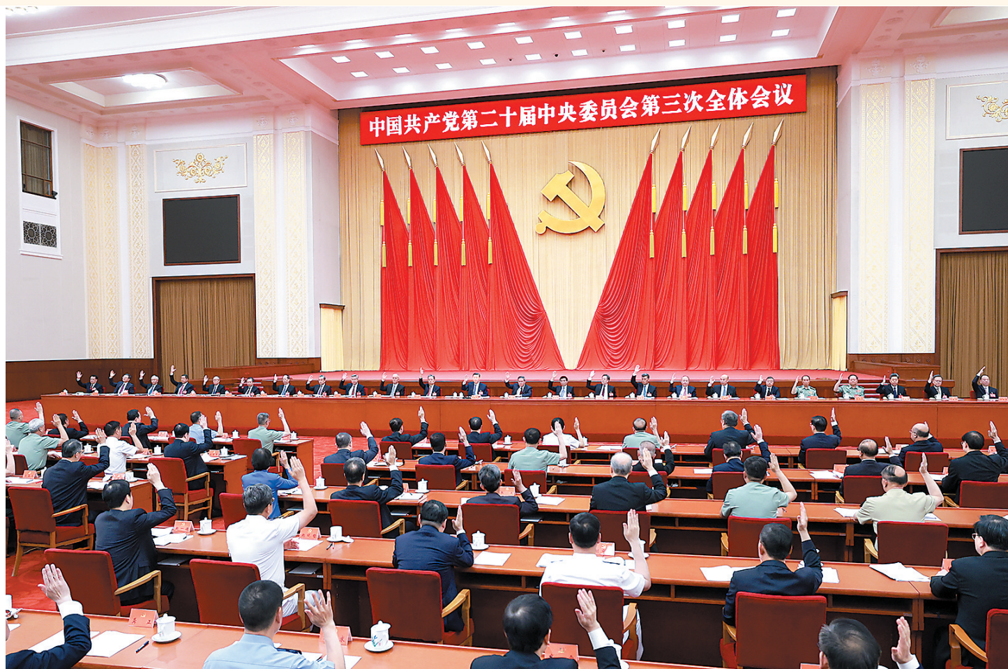
中国共产党第二十届中央委员会第三次全体会议,于2024年7月15日至18日在北京举行。 中央政治局主持会议。