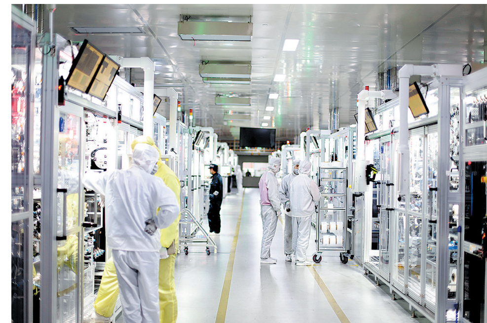
■一批新能源汽车产业链企业在青岛聚集壮大。图为青岛国轩电池高度自动化生产车间。

青岛作为新能源汽车产业“新势力”城市，拥有一汽解放、上汽通用五菱、奇瑞汽车、国轩高科、力神新能源、特来电等代表性企业，优势在于锂电池材料、电池制造、底盘系统、车内外饰、整车制造等环节，短板在于智能驾驶、智能电控、智能传感器、汽车芯片等环节。发挥“链主”企业的带动力，牵引上下游企业精准补链、