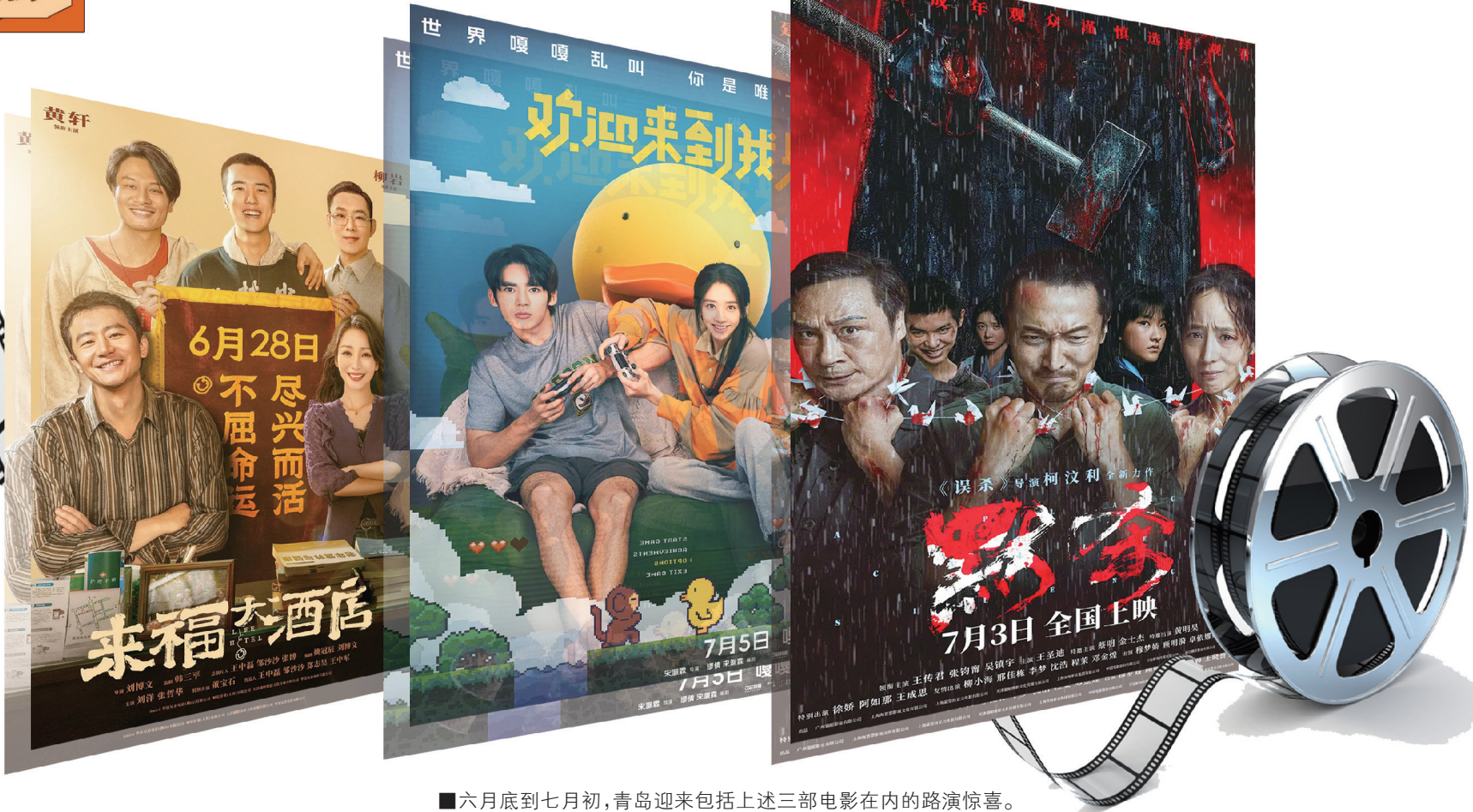
■六月底至七月初，青岛迎来包括上述三部电影在内的路演惊喜。