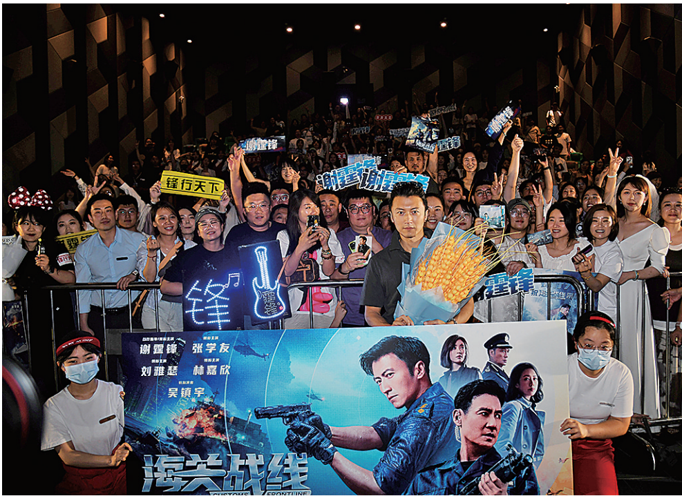
■谢霆锋在青岛推介《海关战线》。

由于儿童剧走进影院，导致剧院的儿童剧演出大幅度减少。据青岛影院经理观察，新开影院的格局正在发生变化，“新影院的银幕前会有个投屏，还会给演员预留空间，未来的影厅既能放电影，也能安排剧院演出。” 随着我国银幕数突破86000块，观影影迷人群也达到平稳期。如何击穿电影市场的天花板、开拓新的影迷群体，如何将观众从短视频平台挪到影院，影院各施奇招。实力雄厚的大型院线推出“预约观影”的思路。观众可以从片单里选择之前错过或想要重温的电影，上座率达到8%—10%就可以成团，满足文艺片影迷、二次元影迷的需求；另一方面，以大象点映为代表的“分众放映计划”主攻文艺片、纪录片放映，从影院到书店深度开掘可以播放电影的空间，将以往的观影会活动提升到新的层面。