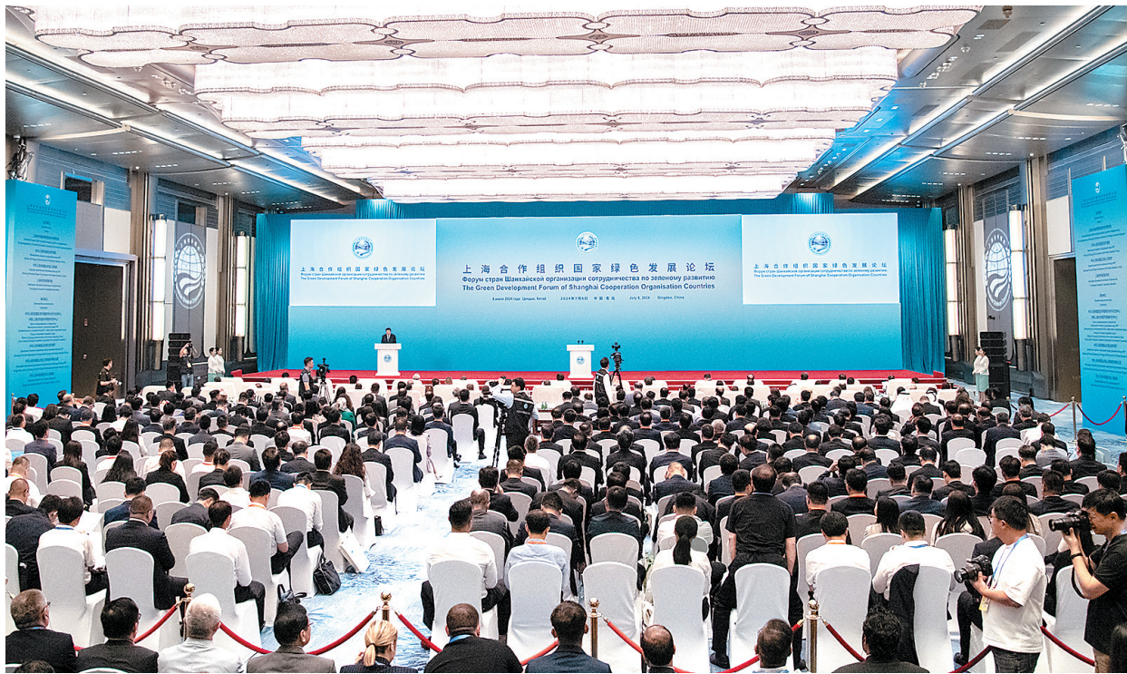
7月8日上午,上海合作组织国家绿色发展论坛在青岛启幕。

黄润秋在致辞时说,中国一贯高度重视生态文明建设和生态环境保护,坚定不移走绿色低碳高质量发展道路,生态文明建设发生历史性、转折性、全局性变化。近年来,上合组织生态环保合作不断深化,为推动全球环境治理发挥了积极作用。习近平主席向论坛亲致贺信,表达了中国希