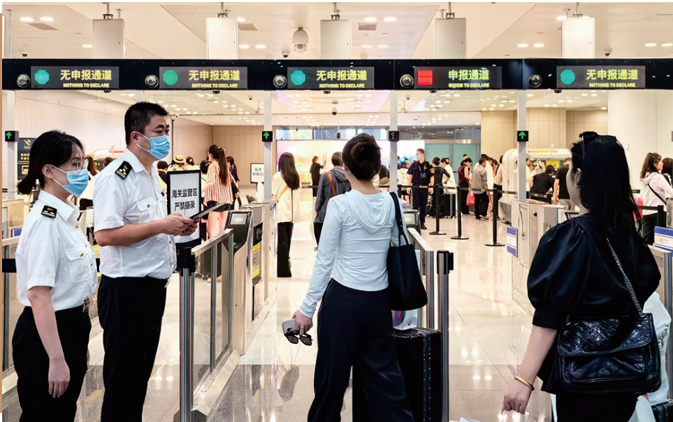
■海关关员正在为进境旅客提供通关指引。