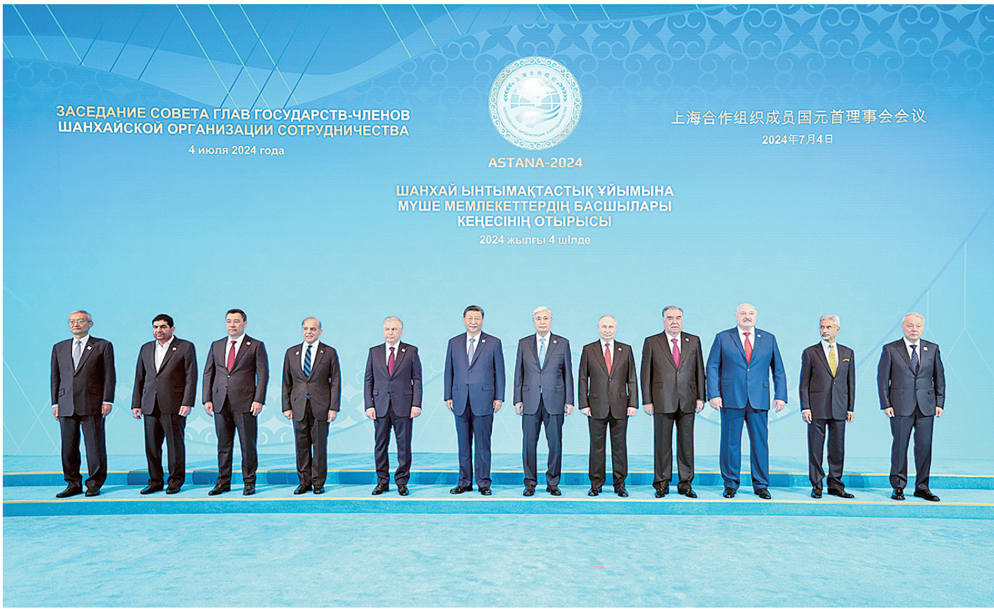
当地时间7月4日上午,国家主席习近平在阿斯塔纳独立宫出席上海合作组织成员国元首理事会第二十四次会议。这是习近平同上海合作组织成员国领导人集体合影。