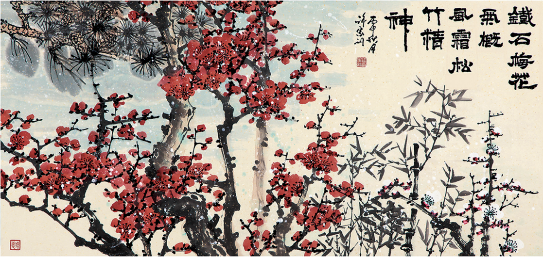
■铁石梅花气概 风霜松竹精神 70×180cm