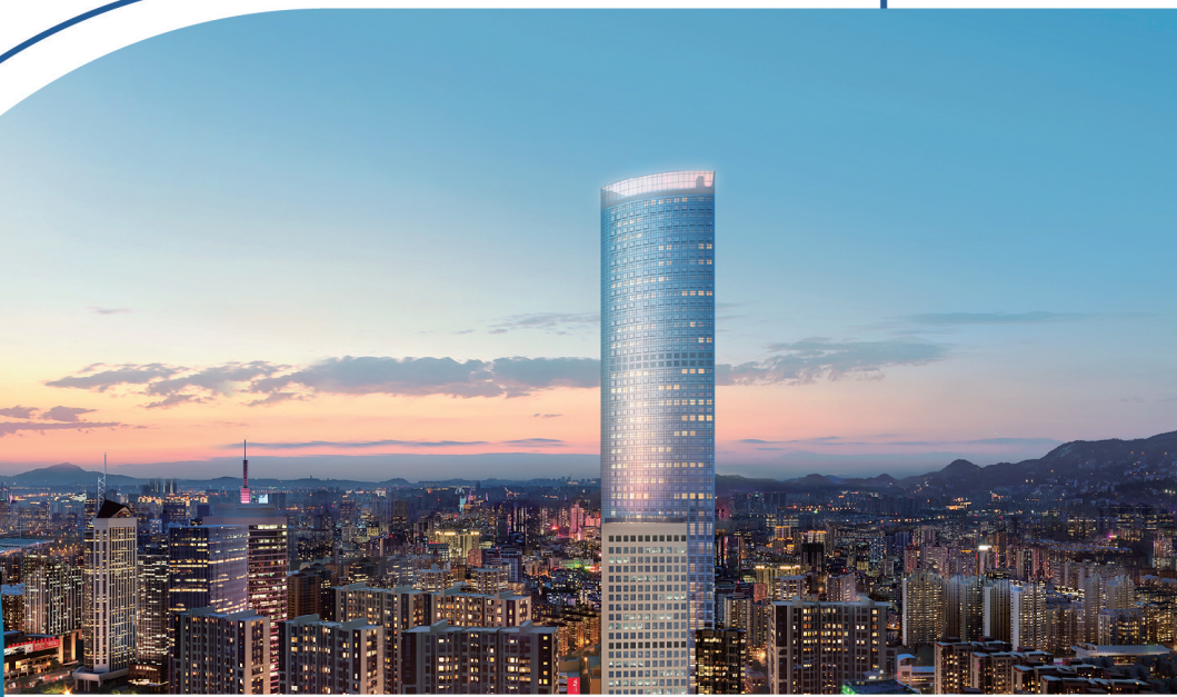
■香港中路80号效果图。