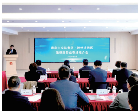
■青岛中央法务区·涉外法务区法律服务业专场推介会。

号梵悦·凌云的青岛首家空中米其林星厨餐厅京潮荟正式开业。餐厅以“对话当下，让食物更有温度”为品牌愿景，以美食“荟聚”与城市产生文化共鸣，创意打造242米高空的青岛美食文化新地标。